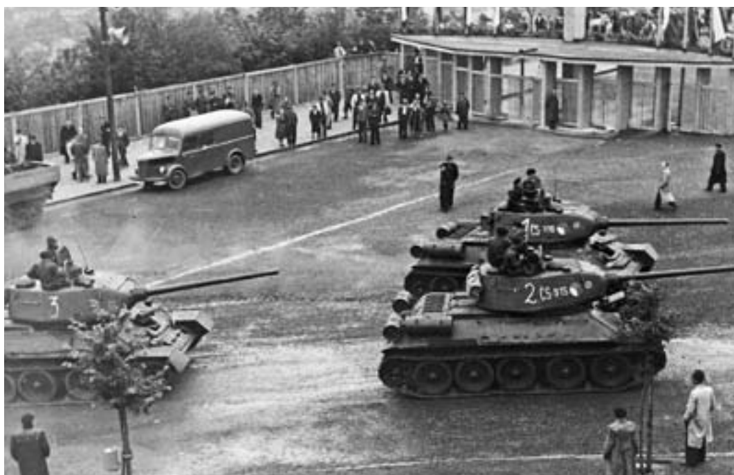
Tanky T-34/85, hlavní síla Tankového sboru, tehdy ještě nepoččetná