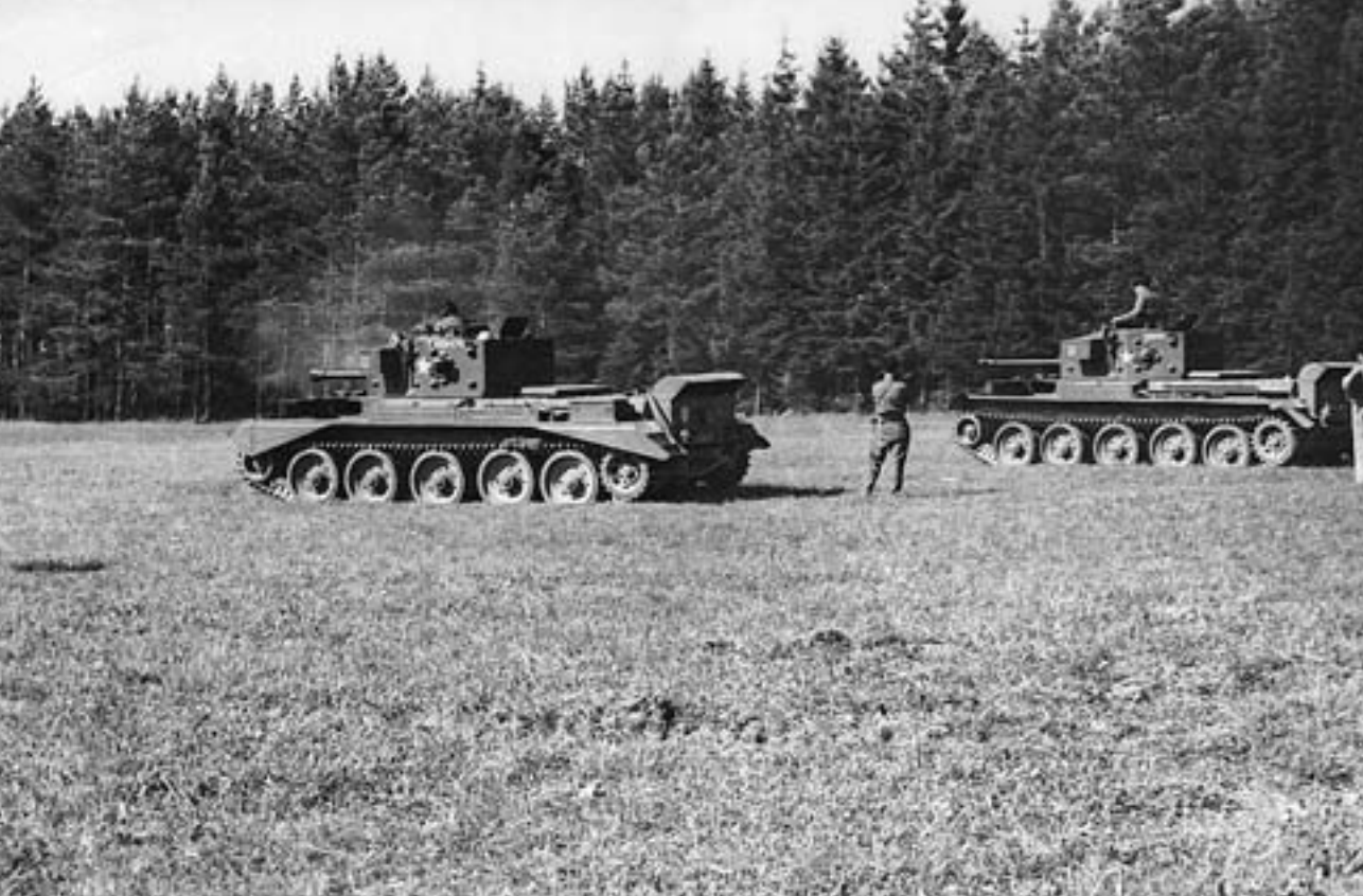
Tanky Cromwell IV při výcviku ve střelbě z kulometu na polní střelnici

ještě 14. brigádu. 1. tankový sbor jako největší úderná síla měl sloužit jako dispoziční jednotka hlavního velitelství operující armády.