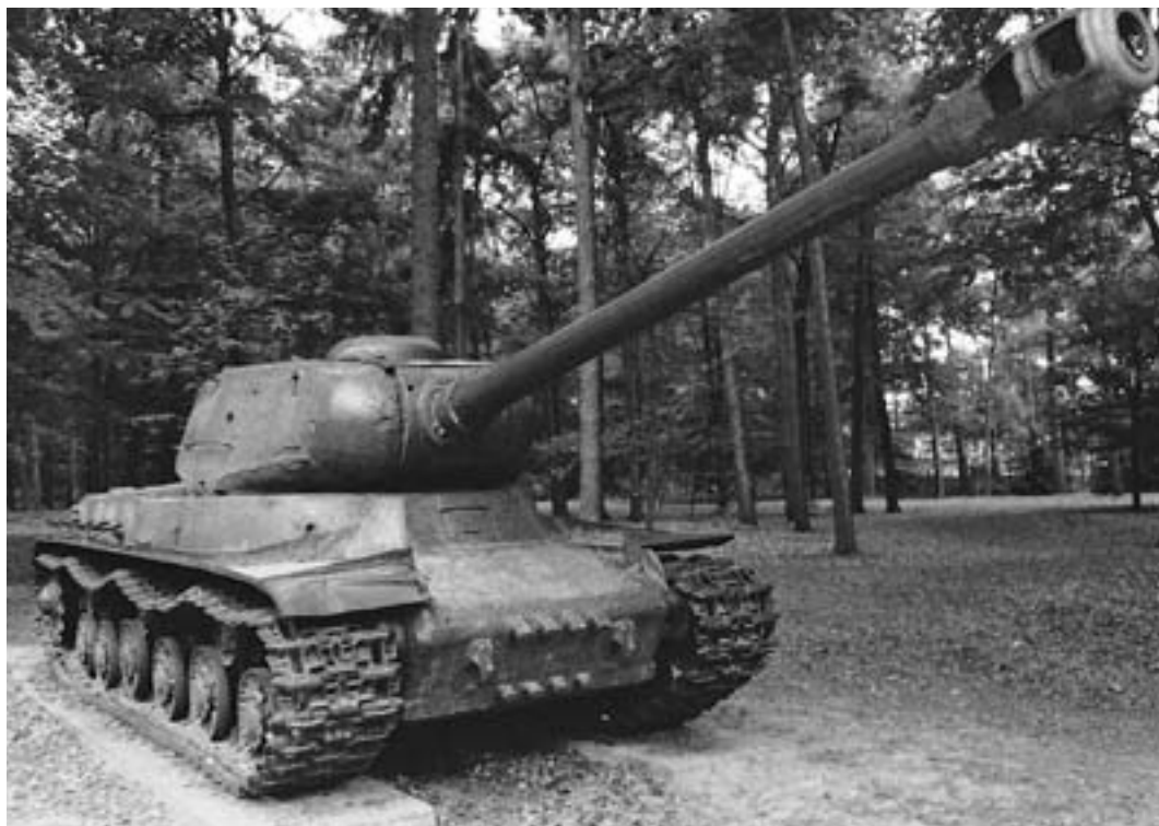
Sovětský těžký tank IS-2 sehrál v československé výzbroji pouze epizodní roli.

Souběžně s organizací a nasazením výše zmíněných jednotek obrněných vozidel při zajišťování pohraničí vzniklo při Ministerstvu národní obrany (MNO) Velitelství tankového vojska (VTV), které pracovalo na vytváření své pevné struktury. Do služby se přihlásilo více než sto předválečných důstojníků útočné vozby, tedy téměř všichni kromě patnácti, kteří zahynuli jako