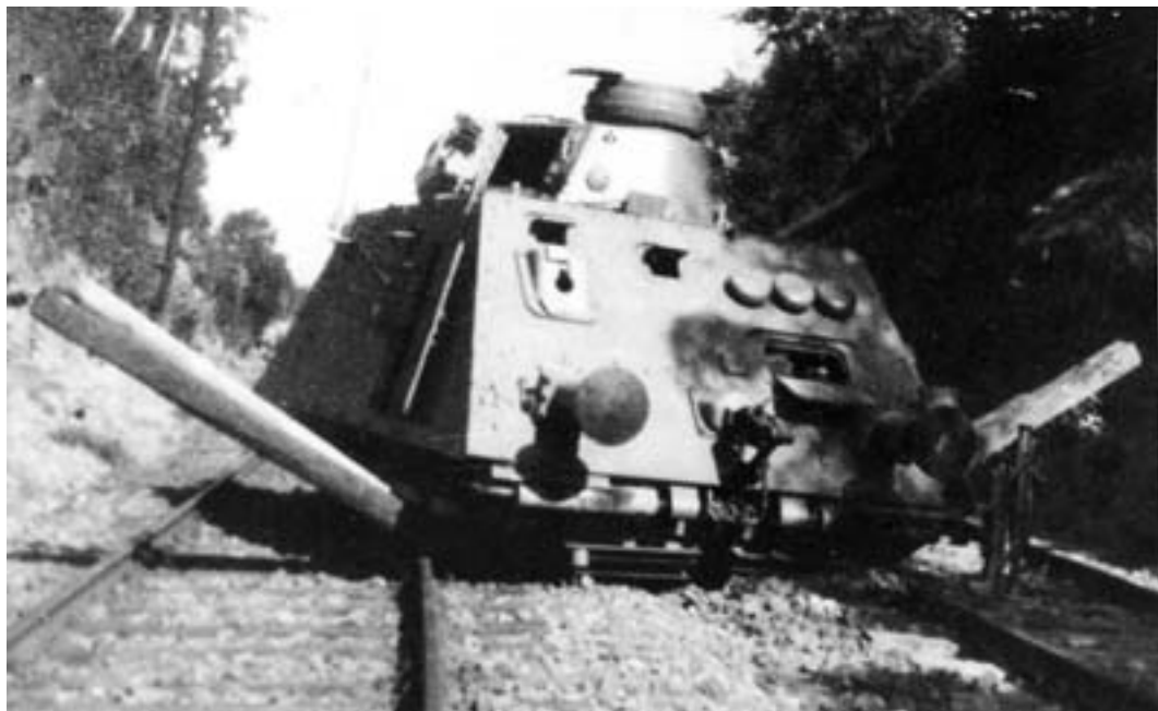
Vykolejený dělový vůz motorového obrněného vlaku v době jeho nasazení v pohraničí