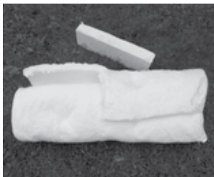
Obr. 3 Ukázka pevné desky a rohože Sibrál

Nejllepším izolantem je vzduch, účelem všech izolací je proto udržet jej v co nejmenších uzavřených, jednotlivě oddělených komůrkách. Lze tedy říct, že izolace musí být v první řadě prodyšná. Dříve se používalo rozemleté sklo, dnes je nejčastěji používanou izolací do pecí Sibrál. Je to v podstatě porcelán rozemletý a roztažený do dutých vláken; jeho teplota tání je daleko za možnostmi přírodního ohně.