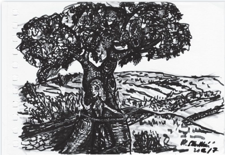
Annu pak přivázala v lese ke stromu.

„Tak dlouho jsem na vás čekala!“ nedala princovi čas na pochybnosti.