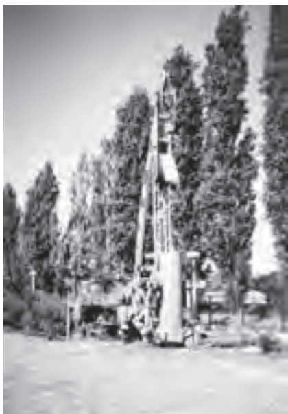
Obr. 2 Vrtání v nepevných horninách