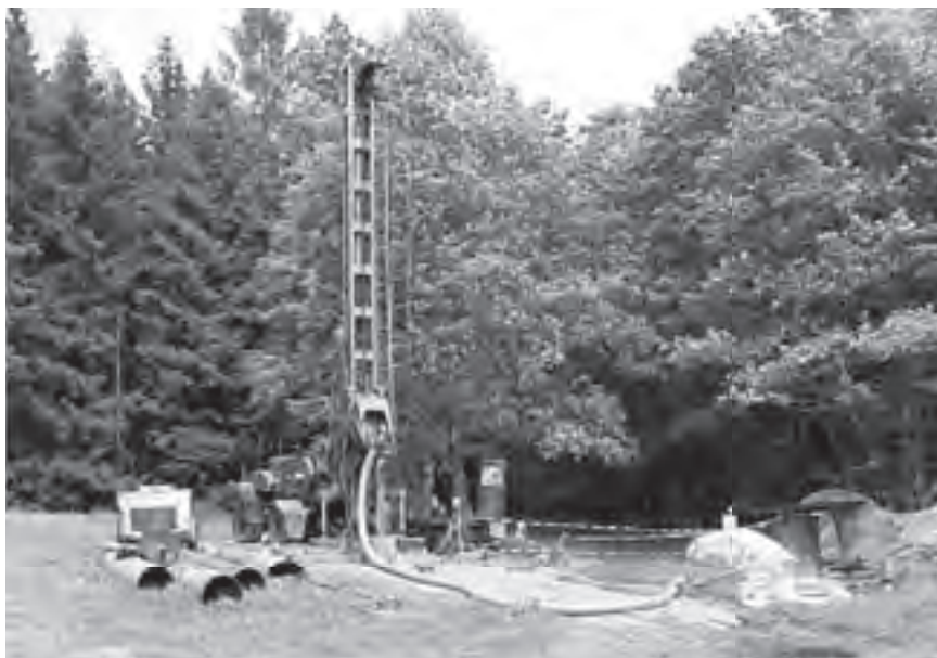
Obř. 3 Vrtání hluboké studny v zahradě zámku Lány

Vysoká jakost této podzemní vody je dána zejména tím, že proudí ve velkých hloubkách a velmi pomalu na velké vzdálenosti horninovým prostředím, kdy dochází k jejímu dokonalému vyčištění a zároveň voda získává potřebné minerály člověku prospěšné. V dnešní době, kdy dokážeme určit stáří podzemní vody, bylo stanoveno např. stáří podzemní vody v pískovcích severních Čech až na 6 000 let.