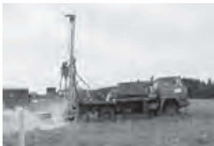
Obr. 4 Vrtání v pevných horninách

Na obrázcích 4 až 6 je technologie vrtání studní v tvrdých horninách na „puklinovou vodu“.