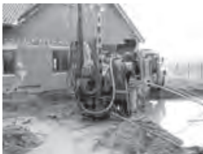
Obr. 6 Jádrové vrtání v pevných horninách