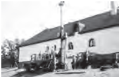
Obr. 5 Rotačně-příklepové vrtání v pevných horninách