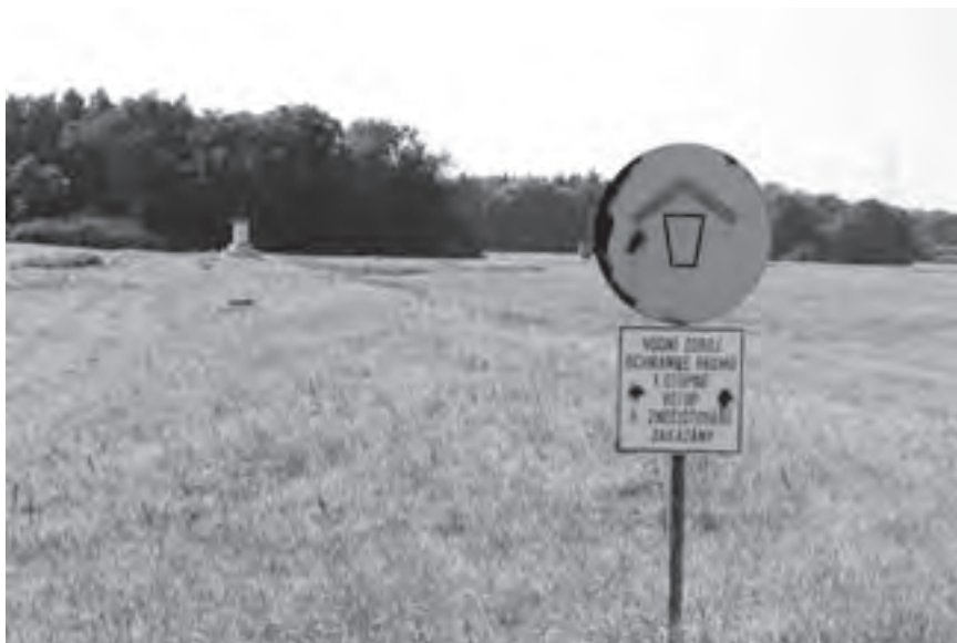
Obr. 1 Jímací území Káraný – mělké kvartérní studny

Soudržné nezpevněné horniny (hlinito-jílovité zeminy, jílovité zeminy, zvětralinové pláště území budovaných metamorfovanými horninami – ruly atp.) mají sice také průlinovou propustnost, ale silně omezenou, což je dáno charakterem hornin. Vydatnosti jímacích objektů (studní) zde bývají nízké až velmi nízké.