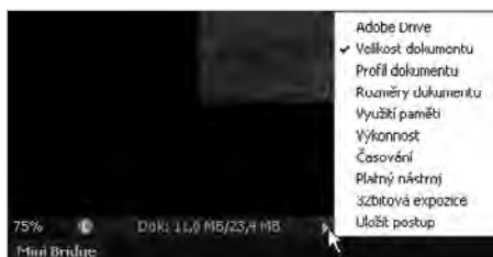
Obrázek 1.4: Stavový řádek

Klepnutím na šipku seznamu u informačního okénka potom můžete vybrat tu informaci, kterou budete chtít vidět v okénku (viz obrázek 1.4).