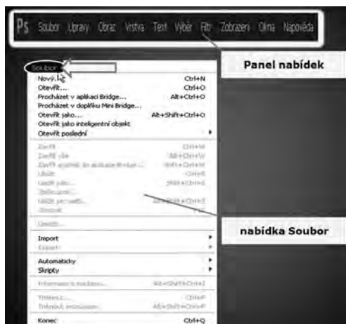
Obrázek 1.2: Nabídka Soubor