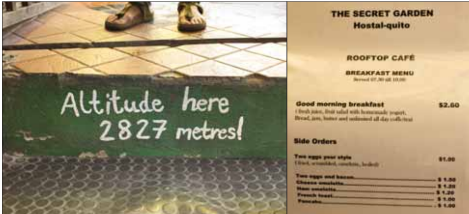
Haligandu môžete objaviť aj vo výške 2872 metrov. Raňajky tam stoja okolo jedného eura až dvoch eur.

- V 1950, vtedy mal dvadsať rokov. Pochádzal z Českého Krumlova. Mama prišla až v 1967.