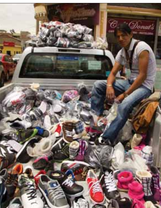
Obchod si môžete otvoriť priamo z auta: večer nahádzate lopatou topánky na korbu a biznis môže ráno začať.

Krútime sa nádhernými kaňonmi, vysypanými malými skalami. Kde-tu sa mihne vodopád, nech krajina nepôsobí ustato. Autobus zastavuje v priľahlých dedinách, berie ďalších cestujúcich, ale nikdy nie je úplne zaplnený. Nakoniec vystupujem na otavalskej autobuske. Je plná nádherne pofarbených autobusov a na rozdiel od Panamy sú v perfektnom technickom stave. Stanica je plná školákov, množstvo žien má oblečené tradičné, nádherne vyšívané kroje. Základ tvoria čierne sukne a biele košele s nazberkanými čipkovanými rukávami, ktoré sú skráslené skromnými, ale o to vkusnejšími výšivkami. Nielen muži majú na hlavách klobúky. Veľmi mi pripomínajú Tibeťanov, ktorých som videl v indickej Dharamsale, kam húfne utekajú pred rozpínajúcimi sa Číňanmi. Veľa mladých mužov má