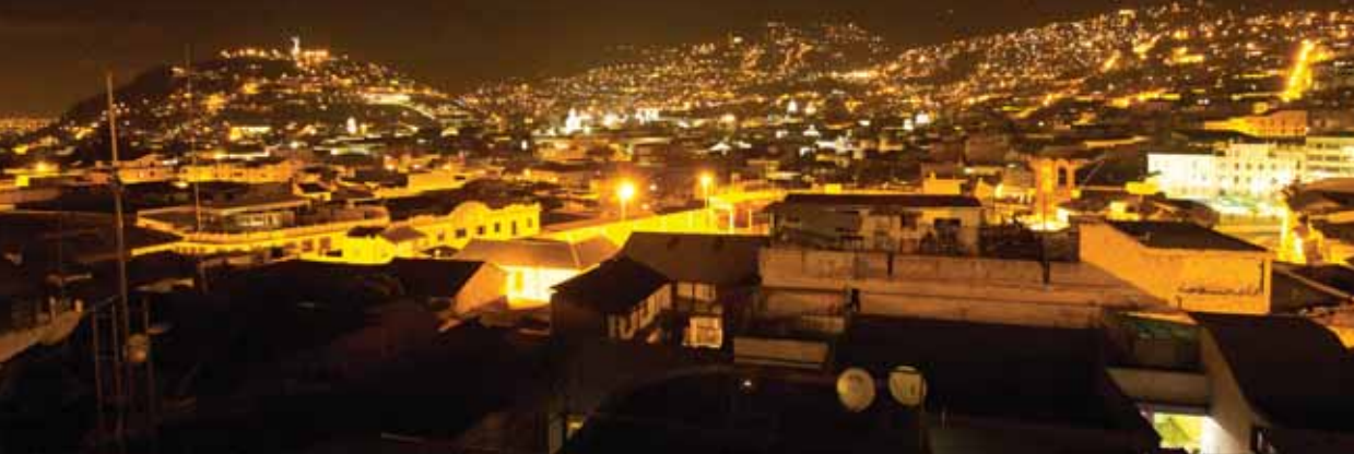
Takto nás privítalo Quito ukladajúce sa akurát na spánok.

biliard, ale ja, Slováčisko, som vraj najväčšie prekvapenie ich trojtýždňového výletu. Upokojujem ich, že hromy nad Tatrou neprestávajú biť, zobúdzajú Slovákov. Boh nás miluje, sme múdri a vyvolený národ so svojim predurčením a s úlohami a hrdo ich splníme. Preberáme sa, cestuje nás s batohmi po svete čoraz viac, nech nemajú strach, ako národ múdrieme cez otlaky, naše duše rastú, lebo prestávame rešpektovať hranice, planétu berieme ako spoločný domov všetkých rás, farieb koží a pováh. Opavčania (aby tých „náhod“ nebolo málo, ja som sa narodil v Ostrave) mi rozprávajú zážitky, dávajú tipy, upravujeme spoločne môj veľmi hrubo načrtnutý itinerár. Kecáme, až kým nás nevyháňa hostelový strážnik, že je čas ísť do hajan.