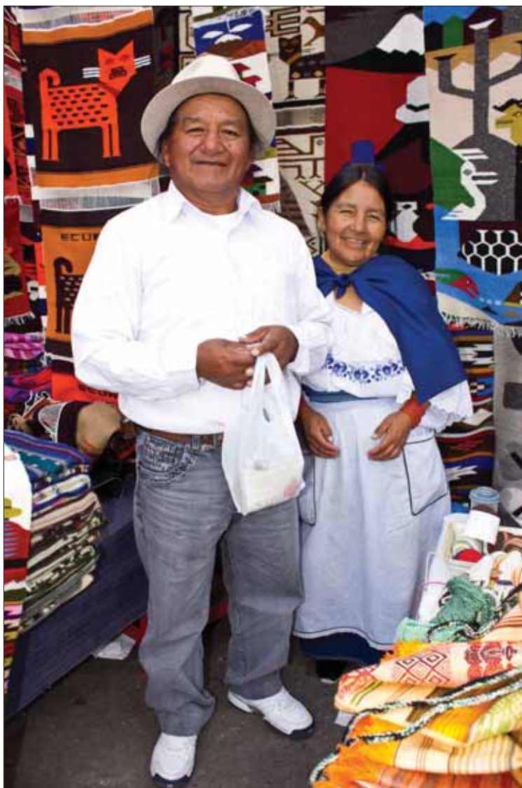
Najviac krásy dokáže žiariť iba z obyčajných ľudí. Na zábere manželský pár z Otavalo.

Keď sa preberám zo spomienok, znova sa ocitám v našom upršanom hlavnom meste na stanici MHD. Je večer, štvrt' na jedenásť. Väčšina čakajúcich sú mladí ľudia. Mlčky, zachmúrení, neusmievajú sa. Možno len zrkadlia slzy neba, ktoré kropia zladovatený chodník i cestu. A medzi nimi stojí jeden pútnik, obyčajný z obyčajných, ktorý si ide znova do sveta po odpoveď, či ľudia, ktorí sa narodili a žijú bližšie k rovníku, majú v srdciach viac slnka, pohody a pokoja. Či my Slováci máme vďaka štyridsiatej deviatej rovnobežke právo na obavy, strachy, náhlenie, závisť, zlobu a večnú nespokojnosť.