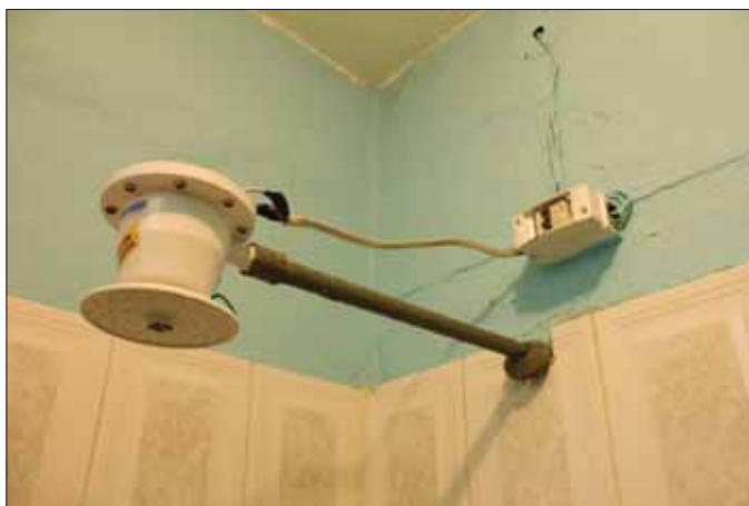
Sprcha v Hosteli Secret Garden. Ak vás prestal baviť život, stačí otočiť ružicu sprchy smerom na káble... Aby som to odfotil, musel som sa vrátiť na izbu pre foťák. Hmm, možno som vyzeral divne. Čo si asi pomyslíte o týpkovi, ktorý si berie do kúpeľne fotoaparát?

Budík si dávam na 7.30, keď sa začínajú raňajky. Chvíľku si ešte čítam Osha, ktorý sa už dávno stal súčasťou každej mojej cesty. Oči po chvíľke samy zatvá-