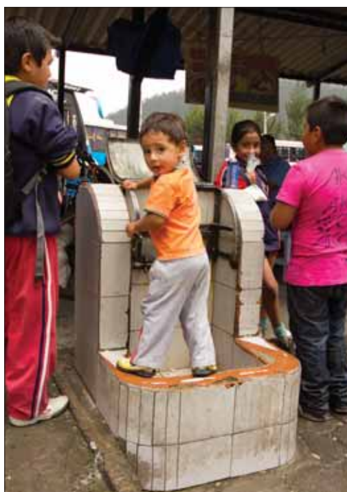
Všetky děti sveta sú nádherné.