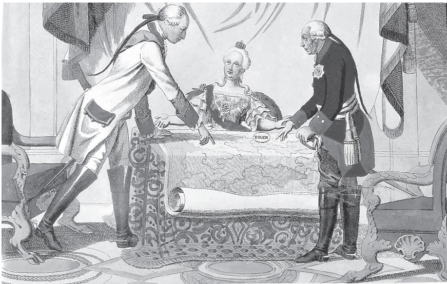
Josef II., Kateřina II. a Fridrich II. při prvním dělení Polska

o třicet procent své územní rozlohy a třicet pět procent obyvatel. Rakousko nakonec získalo Halič a Vladimírskou oblast s 83 000 kilometry čtverečních a 2 650 000 obyvateli, což sice na první pohled nebyl špatný výsledek, ovšem i když Prusko získalo pouze 36 000 kilometrů čtverečních s 580 000 obyvateli, jeho zisky byly jednak hospodářsky vyspělejší, jednak nabytím Západních (Královských) Prus se Fridrichu II. podařilo spojit Braniborsko s Východním Pruskem v jeden územní celek. Rusko získalo jen 1 300 000 obyvatel, ovšem celková rozloha jeho kořisti dosáhla 92 000 kilometrů čtverečních a díky ní se tento východní obr navíc posunul dále na západ, což představovalo nesporný geopolitický úspěch. Vzhledem k hospodářské a sociální zaostalosti a strategické bezvýznamnosti vlastních teritoriálních zisků Rakousko rozhodně nedosáhlo žádné změny v rovnováze sil mezi těmito třemi mocnostmi a lze právem pochybovat o tom, že pro samotnou monarchii představovaly vůbec nějaký přínos. Ze stejného důvodu zdaleka nevyvážily ztrátu bohatého Slezska, třebaže měly dvojnásobně větší rozlohu a o milion obyvatel více. 16