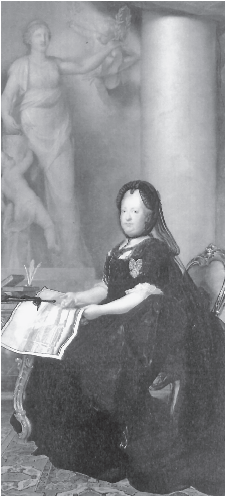
Marie Terezie na portrétu z roku 1773 se sochou symbolizující mír

rakouským zbráním přálo štěstí, měli bychom z toho jen malý užitek. Dvě tři vítězné bitvy nám nedobudou žádné území ve Slezsku; k tomu by bylo třeba dlouholetého boje, jak ukázal rok 1758. A kdyby válka skončila nešťastně, jednalo by se o samotné bytí států.“ 10 Navíc sama