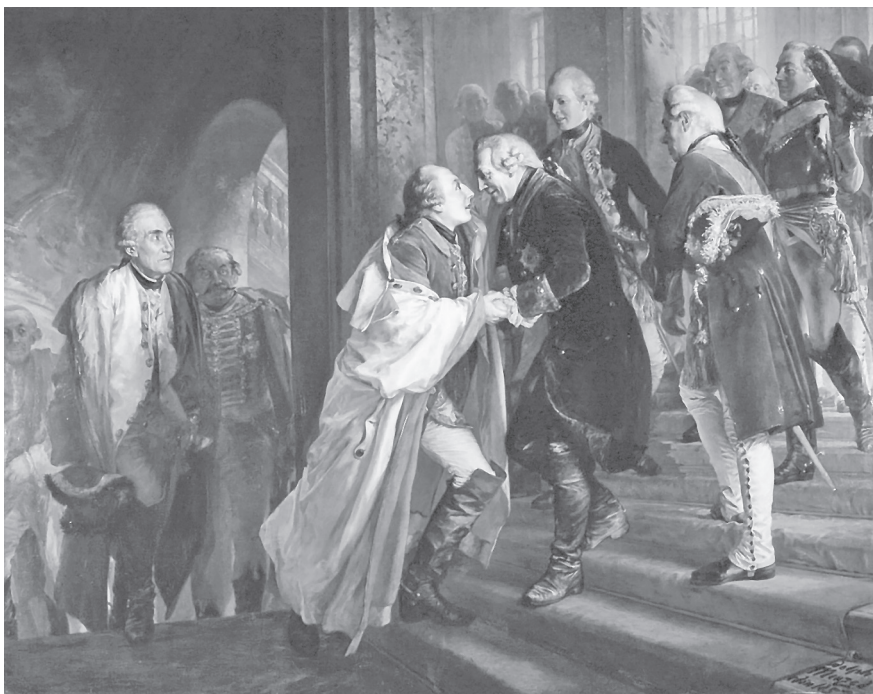
Setkání Fridricha II. a Josefa II. v Nise roku 1769

prokázal svůj diplomatický talent již na mírovém kongresu v Cáchách v roce 1748, o dva roky později se stal vyslancem v Paříži. Po návratu do Vídně v roce 1753 byl ve svých šestatřiceti letech jmenován dvorským a státním kancléřem. O deset let později sdílel názor Josefa II., že je žádoucí nepřestat usilovat o nová území, zvláště když toho bylo možné dosáhnout diplomatickou cestou. Stejně jako mladý císař, i on byl v tomto úsilí motivován především ohledem na Fridricha II., o kterém v roce 1777 napsal, že jeho politikou je škodit Rakousku tak moc, jak je to jen možné, a proto je mírová koexistence s ním vždy pouze dočasná. 15