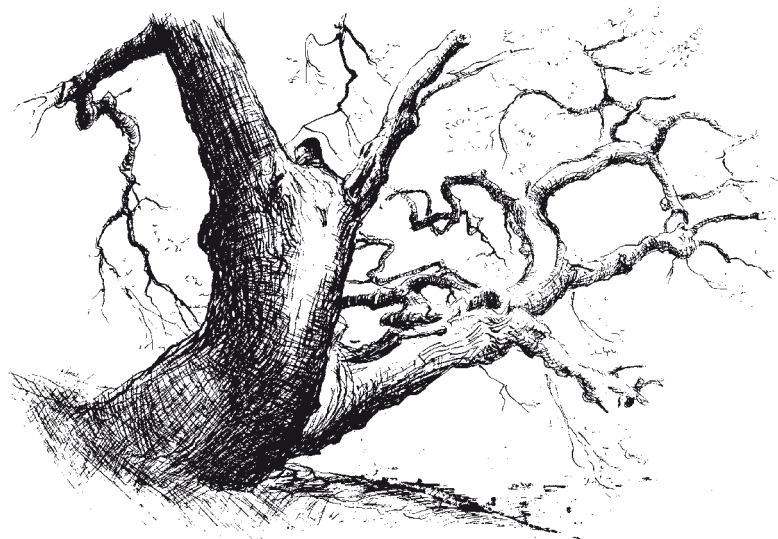
Dub nad Rožmberkem ( J. Turek ).

Příjem vody kořeny je ovlivňován například teplotou půdy (v teplé půdě buňky intenzivně dýchají a mohou přijímat více vody), obsahem kyslíku v půdě (při nedostatku kyslíku je znemožněno dýchání a příjem vody, zastavují se i metabolické procesy), obsahem nerostných látek (na zasořených půdách rostliny trpí nedostatkem vody, na půdě přehnojené minerálními látkami dochází k tzv. fyziologickému