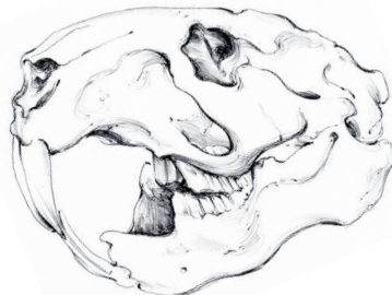
FIG. 1: DVA RADY ZUBOV – VONKAJŠIE REZÁKY A VNÚTORNÉ PREŽŮVACIE ZUBY.

PREČO JU ANI VLASTNÁ MAŤ NEZNÁŠA: Pokiaľ ide o korisť, je MVK nenáročná, stále častejšie však hlásia aj útoky na ľudí . Loví najmä večer a v noci. Je extrémne dobrý plavec, ovláda všetky plavecké štýly vrátane kraulu, motýlika a znaku. V mestách žije spravidla v kanalizácii, kde sa živí predovšetkým odpadom, ale aj menšími krysiami. V obdobiach, keď sa v kanalizácii nachádza primárne potravy, ju možno vídať aj v temných uličkách mesta – ak má dost silu na to, aby vyliezla šachtou a zdvihla kanalizačný poklop. Okrem toho sa dokáže veľmi šikovne zakrádať po svojich krysič špičkách.