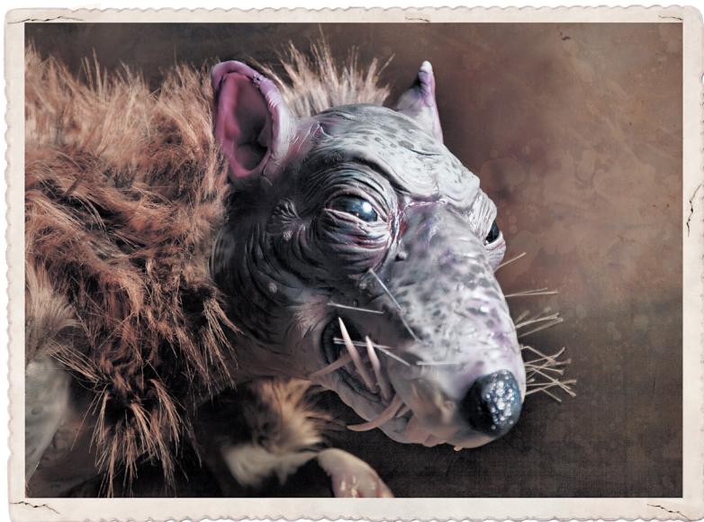
Mongolská vodná krysa, ktorú spozorovali na Ulici Corta Adelera, Oslo, august 2009