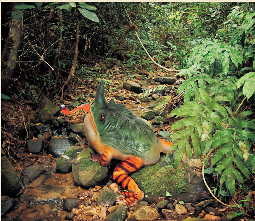
Nosorožaba útočí, Venezuela, Silvestrovský večer 1991.