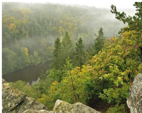
Otava pod Májovkou