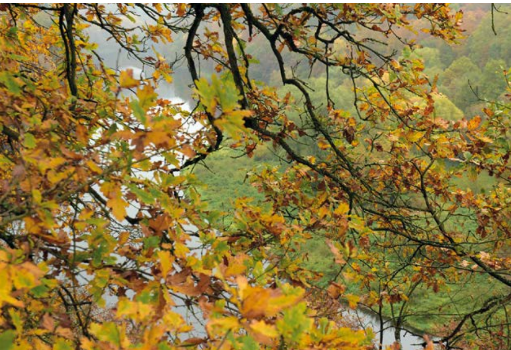
Pohled na Otavu po proudu

Přírodní památka Dubná byla prohlášena chráněným územím o výměře 1,46 ha v roce 1973. Nachází se na pravém skalnatém břehu jen několik stovek metrů před vyhlídkou, bohužel na opačné straně, tudíž přístup k ní by znamenal návrat po červené směrem k Písku až na Plynovou lávku a pak cestu po zelené na pravém břehu po proudu Otavy. Hlavním důvodem, proč je toto území chráněné, je reliktní bor, teplomilná doubrava a především nejpočetnější populace medvědice lékařské v jižních Čechách. Území je přístupné po lesní cestě vedoucí podél horního