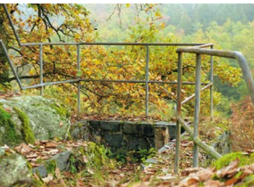
Vyhlídková zídka a zábradlí

Zámek není veřejnosti přístupný. Další zajímavostí je kostel sv. Jakuba, založený jako gotický již v roce 1407. V předstíni kostela se nachází náhrobní kámen rytíře Ludvíka Loreckého a jeho dvou