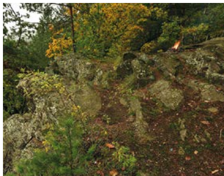
Skály na okraji vyhlídky Májovka

v tomto úseku protéká Otava Národním parkem Šumava.