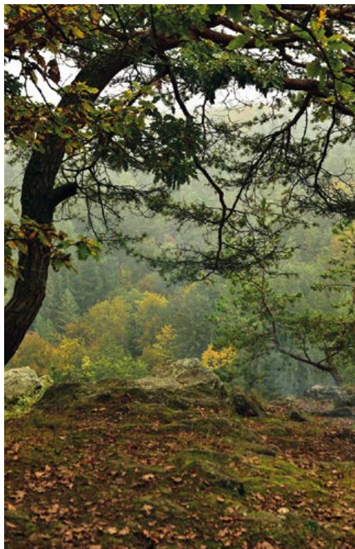
Plošina vyhlídky Májovka