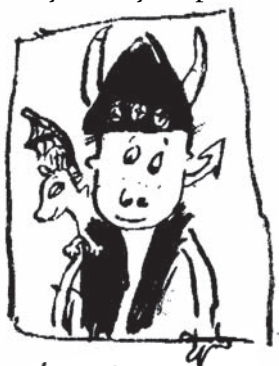
Škyták a Bezzubka

Jak zamotat dračí příběh je pátá část Škytákových pamětí. Autor je mnohem známější díky svému vynikajícímu přírodovědeckému spisu Vikinští draci a jejich vejce , v němž popisuje všechny dosud známé druhy dračků. Vydal ještě další dvě odborná díla, Dračtina pro samouky a Mořské panny a jiné příšery , a byl rovněž pravidelným korespondentem měsíčníku Velcí draci .