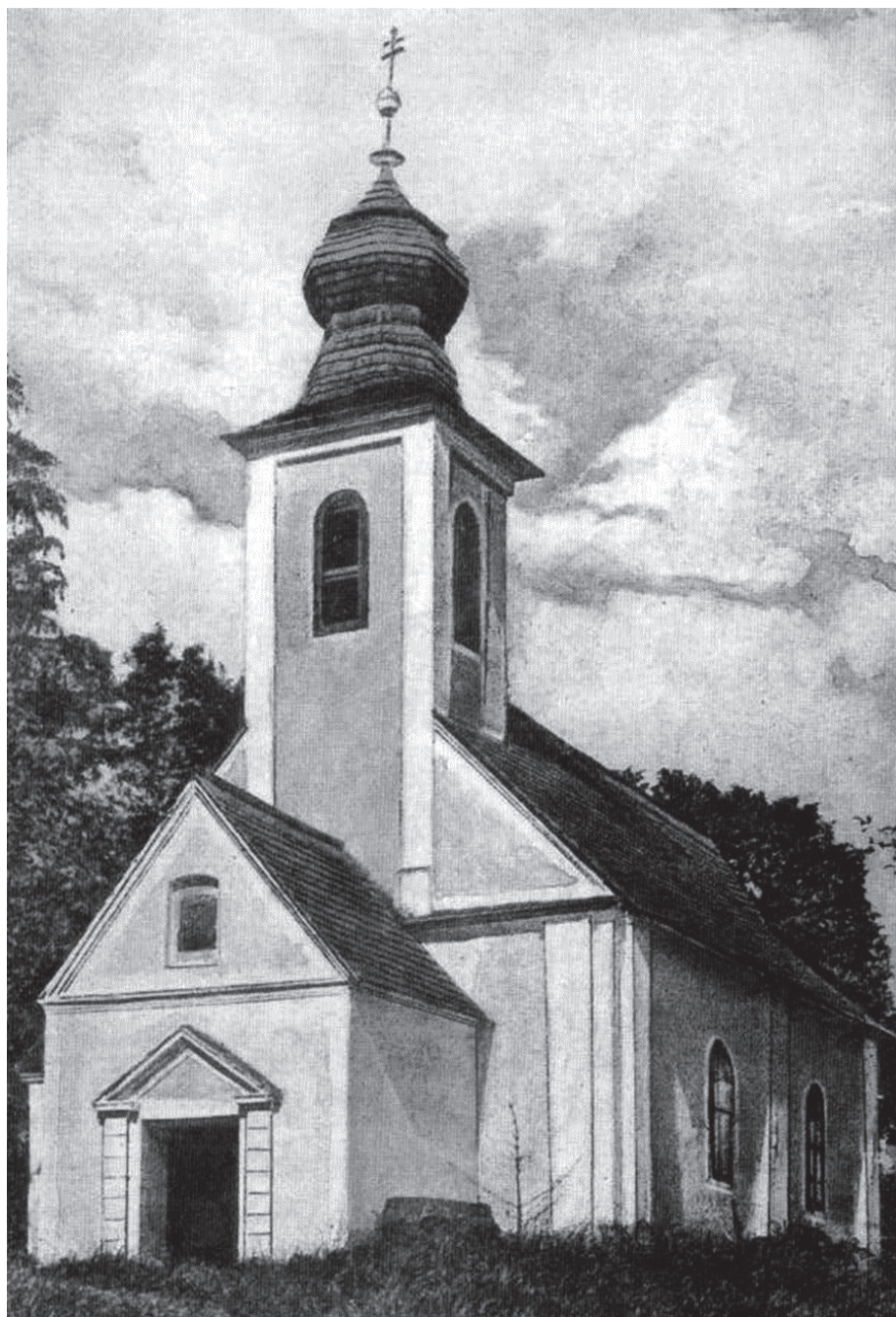
Starý farský kostol v Udavskom z r. 1701, v ktorom bol Jozef Tomko pokrstený