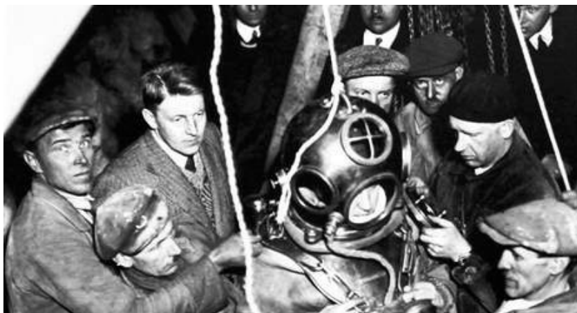
První výprava pod hladinu