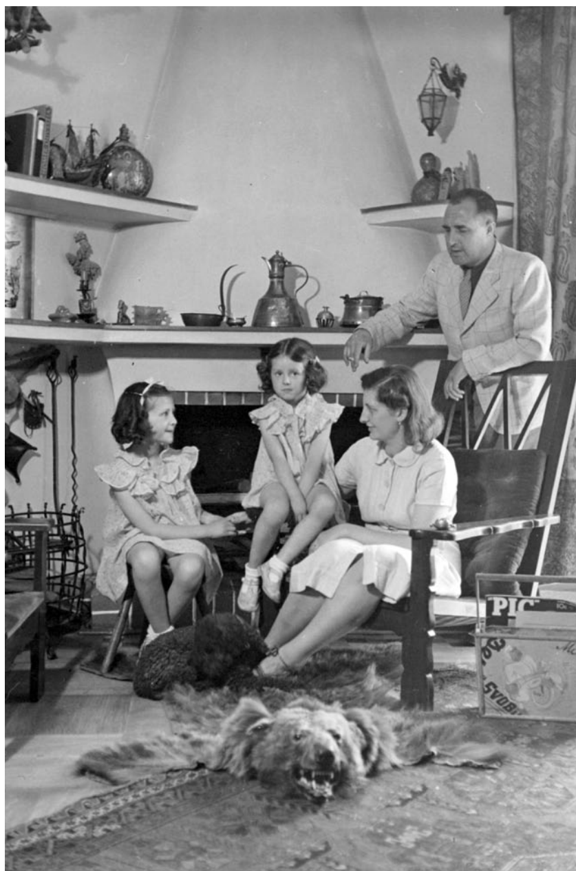
Tamara, pudlík Puk, Nina, Elmarita, Tunal – dodnes jsou věci v brněnské vile na svém místě