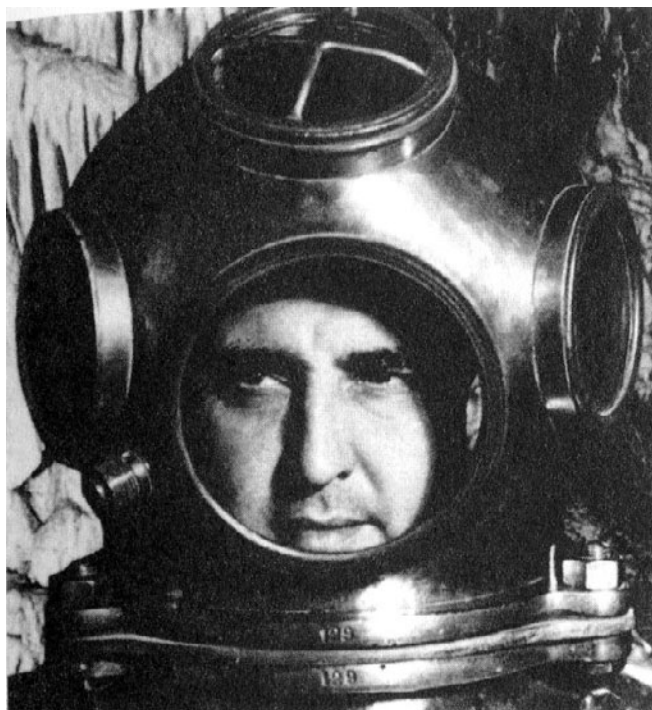
Tunal – muž mnoha profesí