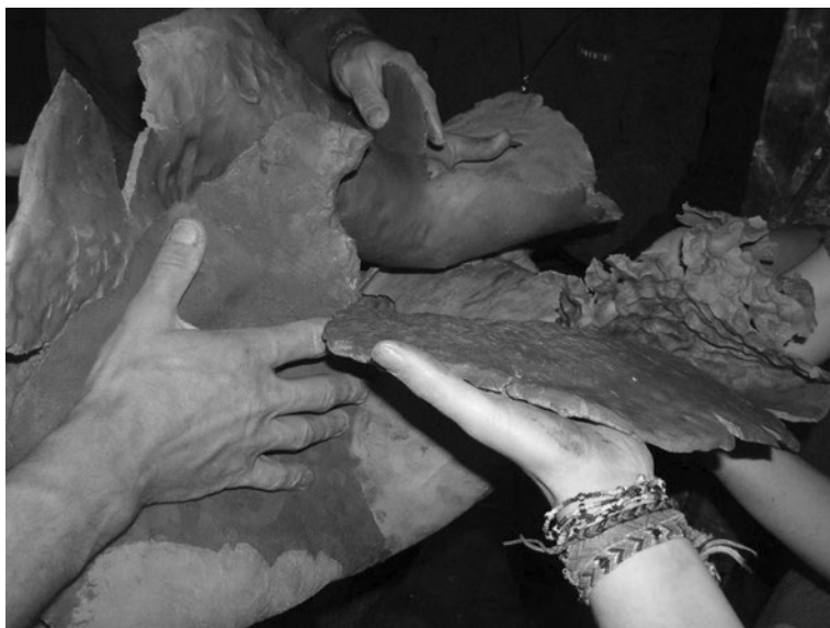
Obr. 2 Ruce – technika z autorského kurzu Znáš svou tvář (2004), součást projektu Obyčejní lidé

Zkušenost není to, co člověk potká, ale co člověk udělá s tím, co ho potkalo. (A. Huxley)