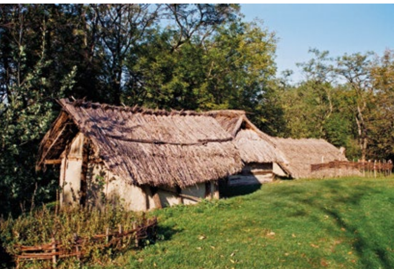
SKANZEN V BŘEZNĚ

dva byly úspěšné, rozhodující Dagobertův utrpěl zdrcující porážku v „třídenní bitvě“. Tu si představujeme nejspíš jako tři dny opakovaných pokusů o dobytí pevnosti než jako nepřetržitý, soustavný boj. Poté Fredegar jen drobnými zmínkami na dalších místech kroniky doplňuje, že Slované se uhájili natrvalo, navíc se ke spolenectví se Sámem přiklonily další kmeny: Dervan, vévoda národa Srbů, kteří byli z rodu Slovanů a již dávno patřili ke království Franků, přidal se se svými lidmi ke království Sámovu.