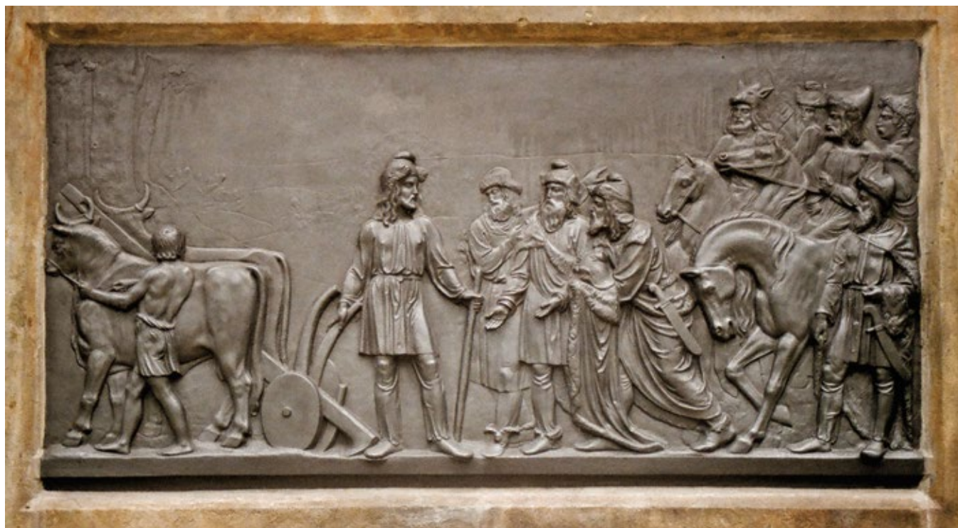
DETAIL RELIÉFU – POSELSTVO U PŘEMYSLA

chlapec vstříc i tázali se ho, řkouce: „Slyš, dobrý chlapče, jmenuje se tato ves Stadice? A jestliže ano, je v ní muž jménem Přemysl?“ – „Ano,“ odpověděl, „je to ves, kterou hledáte, a hle, muž Přemysl nedaleko na poli popohání voly, aby dílo, jež koná, hodně brzo dokonal.“ Poslové přistoupivše k němu pravili: „Blažený muži a kníže, jenž od bohů nám jsi byl zrozen, ... vypřáhni od pluhu voly, změň roucho a na koně vsedni! (...) Paní naše Libuše i všechen lid vzkazuje, abys brzy přišel a přijal panství, jež je tobě i tvým potomkům souzeno. Vše, co máme, i my sami jsme v tvých rukou; tebe za knížete, tebe za soudce, tebe za správce, tebe za ochránce, tebe jediného sobě volíme za pána.“