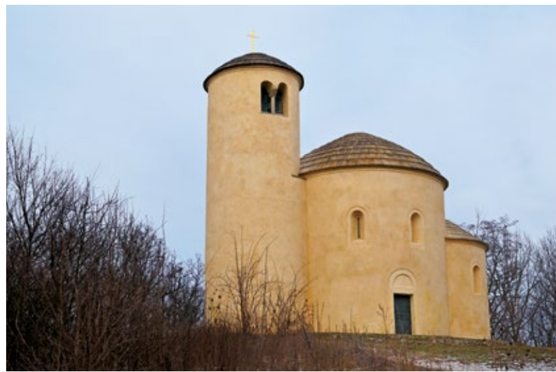
ROTUNDA SV. JIŘÍ

zemi zaslíbenou, je Kosmas nejstručnější: neví kdo, kdy, odkud a vlastně ani kam přišel (doslovně píše tuším kolem hory Řípu ). Zato Hájek prokázal svou beletristickou zdatnost – určí i datum, přesný počet lidí a spoustu jiných informací včetně jména Čechova bratra Lecha, který pak sehrál svou roli i v dalších pověstech (třeba o vzniku Kouřimi, ale někdy též při osídlení Polska Lechity). V tomto případě se řídil heslem: proč přiznávat nevědomost, věrohodněji přece působí přesné údaje – tak si je vymyslím. A nedosti na tom, ještě přibíjíme fiktivní praotcův pohřeb v Ctiněvsi pod Řípem (kde byl hrob později mnohokrát hledán!): Léta 661 od toho času, jakž jest všel Čech do země, léta sedmnáctého a věku svého osmdesátého šestého kníže Čech umřel... Třetího dne nesli jej málo od jeho přibýtku na západ slunce a na jedné pláni tělo jeho, všickni oupějice a křičíce, líbali a tak je pohřebili. Potom to místo a ten hrob po dlouhý čas navštěvující plakali a klaněli se, všelikou jemu činíce poctivost [prokazující čest]. Po nedlouhém pak času na tom místě ves postavili a pro poctivost toho hrobu Ctiňoves jí jméno dali.