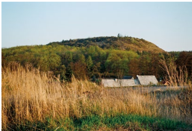
RUBÍN U PODBOŘAN

Problém lokalizace Wogastisburgu je neoddělitelný od stavu poznání toho útvaru, jež jsme si navykli nazývat Sámovou říší. Se slovem „říše“ ale zacházejme opatrně – evidentně se jedná o předstátní útvar, velký kmenový