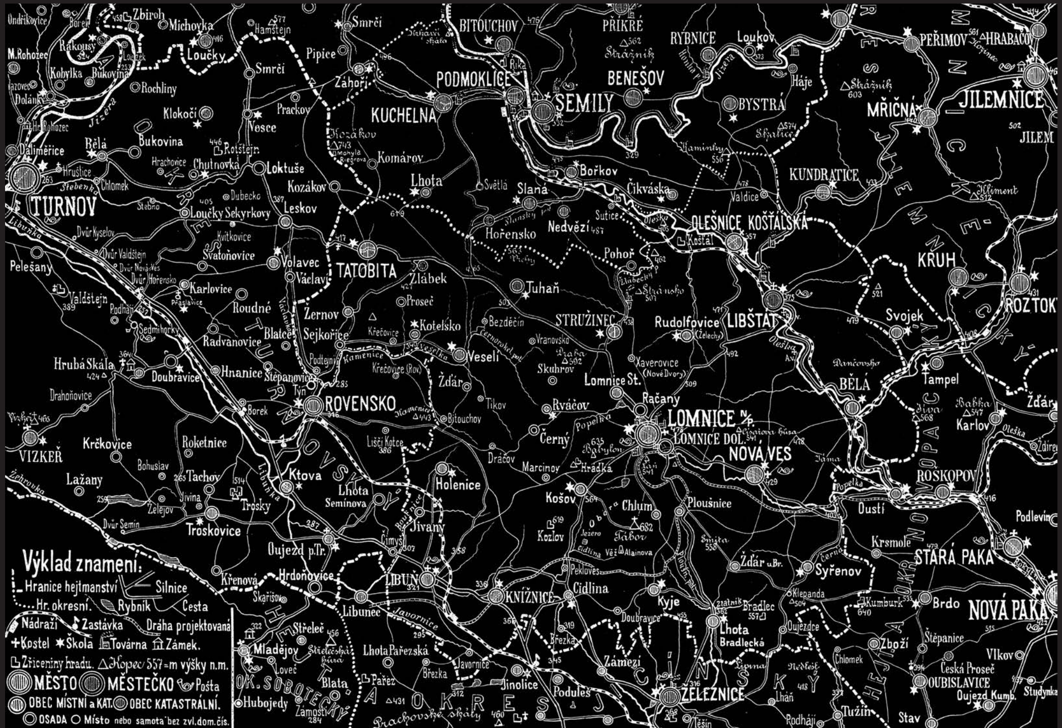
Politický a školní okres Semilský

Nakreslil Jos. J. Fučík, správce školy ve Lhotě Bradlecké