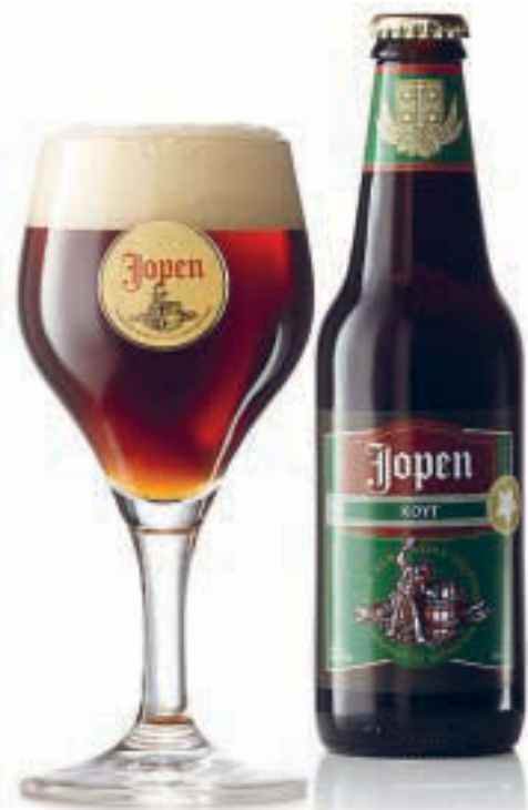
Pivo Koyt z pivovaru Jopen je uvařeno bez chmelu podle receptu objeveného v městském archivu města Haarlem v Holandsku, kde pivovar sídlí. Recept pochází z roku 1407.

Složení bylin ve směsi gruit – zpravidla obsahovala rojovník, řebříček a voskovník –