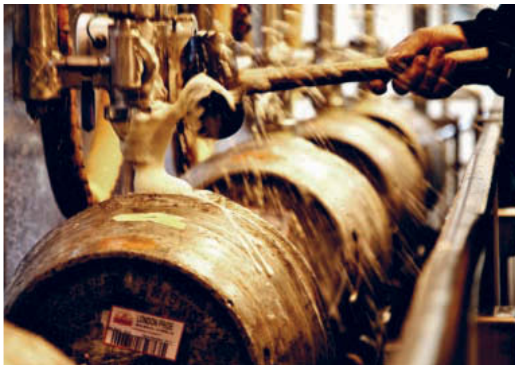
Tradice ustupují pokrokové technologii. Jsou však pivovary, kde stále ctí tradiční postupy.

Veškeré kvašené nápoje svým obsahem alkoholu a mnohdy i díky přítomnosti jiných prospěšných látek, např. resveratrolu, zaručovaly ochranu proti infekci a pily se po celý den. Byly ale opravdu jen minimálně alkoholické, alespoň ty, co byly určené pro ženy, děti či obyčejné lidi.