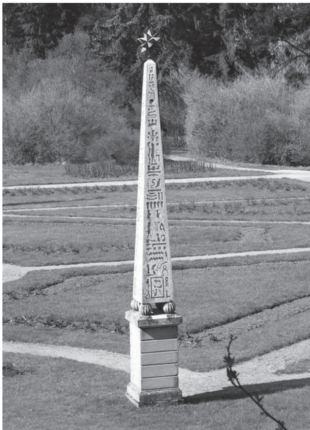
Kopie egyptského obelisku. Růžová zahrada, Konopiště

Je tedy mylná představa, že vážný zájem o Egypt projevil až Napoleon, který tam spolu se svojí armádou vyslal i tým badatelů. To byla pouze první vědecká expedice, zatímco objevitele a sběratele přitahoval obtížně dostupný Egypt už více než sto let.