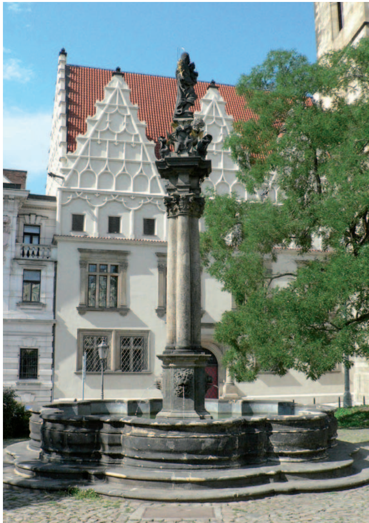
Sloup sv. Josefa před Novoměstskou radnicí v Praze

Tak se průvodním jevem nástupu novověku stal nebývalý nárůst zájmu o řecko-římskou klasiku i o zaniklé kultury Východu. Mezi nimi pochopitelně zaujal stěžejní pozici starý Egypt.