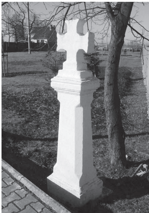
Barokní kříž na vizuálně zvýrazněném sloupku. Velká Dobrá u Kladna

Boleslava I. (do r. 967), který vydal pokyn k jejich stavění. Z kontextu známých skutečností vyplývá, že zdaleka ne vždy šlo o sloupovité objekty (do této skupiny se nejspíše řadily i různé formy křížů) ani nemusely být vždy kamenné. Naopak se zdá, že převažujícím materiálem bylo po celý středověk dřevo. Ale důležité pro nás je, že součástí tohoto širokého a různorodého souboru byly nepochybně i mariánské sošky na vysokých podstavcích sloupovitého tvaru.