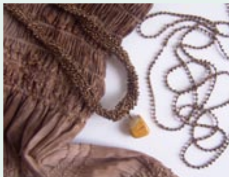
Plochý pásek byl vyroben ze zakoupené tenké šňůrky s vpletenými korálky (vlevo)

Korálky se prodávají v baleních podle druhu a barvy nebo ve směsi, kde obvykle najdeme barvy a korálky, které se k sobě hodí. K dostání jsou také korálky již navlečené, což ušetří čas. Mimo navlečených korálků se také prodávají skleněné korálky vpletené do šňůrky na fotografii nahoře nebo levné umělohmotné kuličky lepené na niti v malých odstupech na fotografii uprostřed. Obojí můžeme použít podobně, jako navlečené korálky.