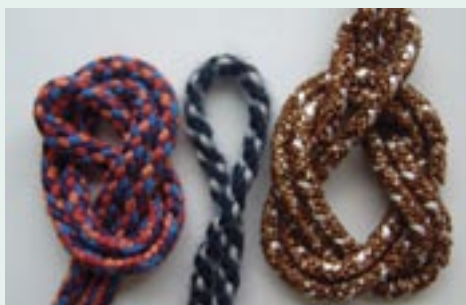
Šnůrky z vyšivacích bavlnek, vlny a gimpy (gimpa je kombinovaná s bílou lacetkou), všechny prameny jsou dvojité

Na splétání se hodí bavlna, vlna i jejich náhražky (akrylová příze apod.). Tyto materiály jsou levné a vhodné na první vyzkoušení.