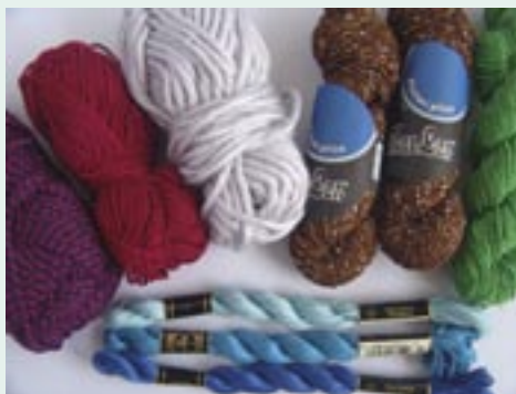
Příze z akrylu, gimpa hnědá a zelená, silné vyšivací bavlnky dole

Materiály s lurexem, metalická vlákna nebo další efektní nitě a příze vyvolávají dojem kovu nebo kov přímo obsahují.