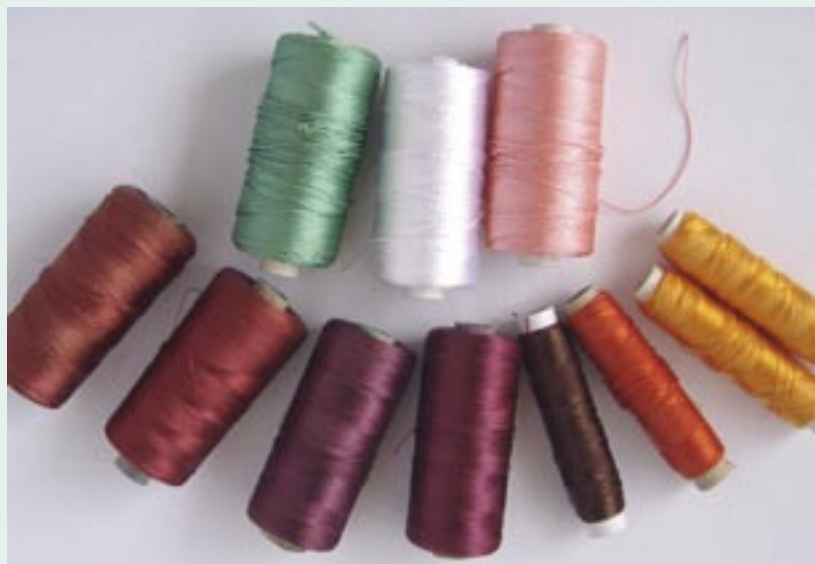
Tenké viskózové vyšivací nitě (vlevo dole), silnější vyšivací nitě (vpravo dole), kordonetové nitě (nahore)

nebo dutinky (jejich střed je dutý) v kreativních sadách. Dostanete je v balení po 3, 25 nebo 150 metrech, nebo si je můžete nechat v galanterii odměřit podle potřeby.