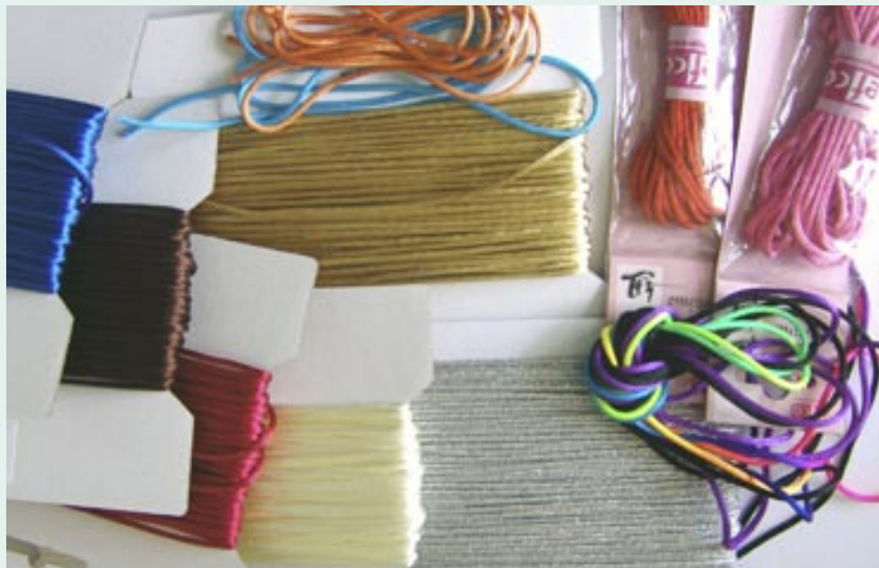
Saténové dutinky v různých baleních

Saténové dutinky se prodávají v malých i velkých baleních. V poslední době se prodávají přímo jako materiál určený pro kumihimo, popř. scoubidou. Prodávají se pod názvem saténové šňůrky