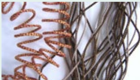
Splétaná šňůrka z bavlnek podle vzoru 2 a lesklé kroucené šňůry

Kombinace červené kroucené šňůry a pramenů nesterjně velikých černých korálků. Pleteno podle vzoru 1, vždy protilehlé prameny stejného typu. Při splétání můžeme místo jednoho z pramenů také použít slabší šňůrku dříve vyrobenou technikou kumihimo