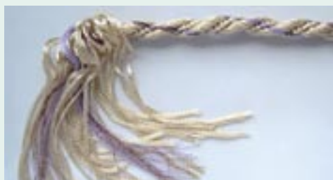
Spirálový vzor kombinující prameny z lacetek a nití (lesklé a efektní)

Lacetky a stužky jsou úzké ploché pásy. Lacetky jsou poddajnější a velmi vhodné ke splétání. Na jeden pramen stačí podle šíře dvě a více. Prodávají se jako příze pro pletení a háčkování. Stužky jsou obvykle pevnější a můžeme je uplatnit například u dutých vzorů (viz str. 32). Šifonové stuhy jsou poddajné podobně jako lacetky. Některé stužky mají okraje vyztužené drátky, i ty lze použít, pokud nejsou příliš široké a pevné.