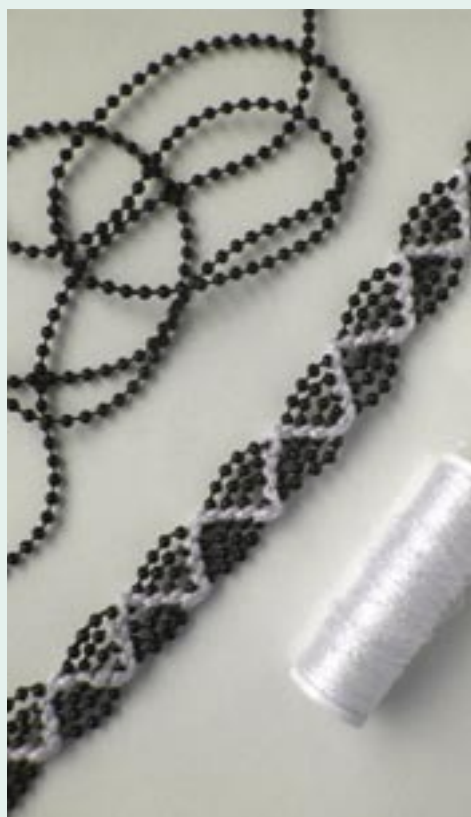
Pásek byl vyroben z kuliček lepených na niti a efektních nití