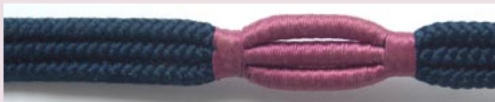
Japonské pásky a šňůry používané na převázání tradičního oděvu

Nové způsoby využití kumihimo nacházíme především v oblasti bižuterie – a to nejen textilní. Splétat lze i zlaté nebo stříbrné drátky. Jednodušší vzory se používají mezi mládeží na výrobu oblíbených “náramků přátelství” nebo přívěšků na klíče, na zipy, pásky, poutka a rukojeti tašek či sponky do vlasů.