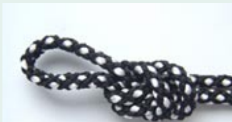
Šňůrka z kordonetových nití a lacetek. Prameny z lacetek jsou bílé a silnější než černé, proto vzor působí plasticky

Pro splétání lze použít jakýkoli ohebný materiál. Pro ozdobné šňůry a pásky se v Japonsku původně používalo nespředené hedvábí. V současné době se můžeme setkat s nejrůznějšími materiály od tkaných textilních vláken přes drátky a bužírky. Materiály se také často kombinují a používají se v nejrůznějších barvách. Ke splétání je možné použít široké spektrum textilních vláken. Nejčastěji se používají materiály s leskem jako hedvábí nebo viskóza. Různé materiály lze mezi sebou kombinovat a docílit nerůznějších efektů. Některé mohou být lesklé, jiné roztřepené, slabé, silné nebo různě vzorované.