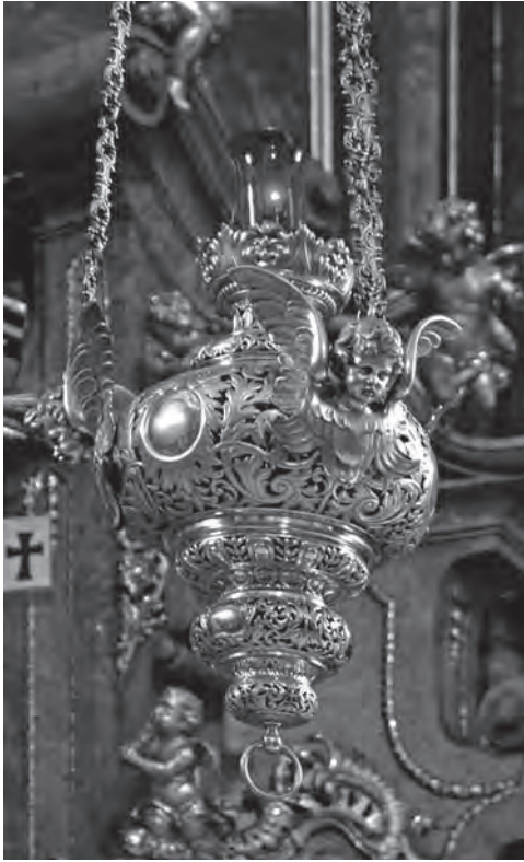
■ Věčné světlo, pasířská práce