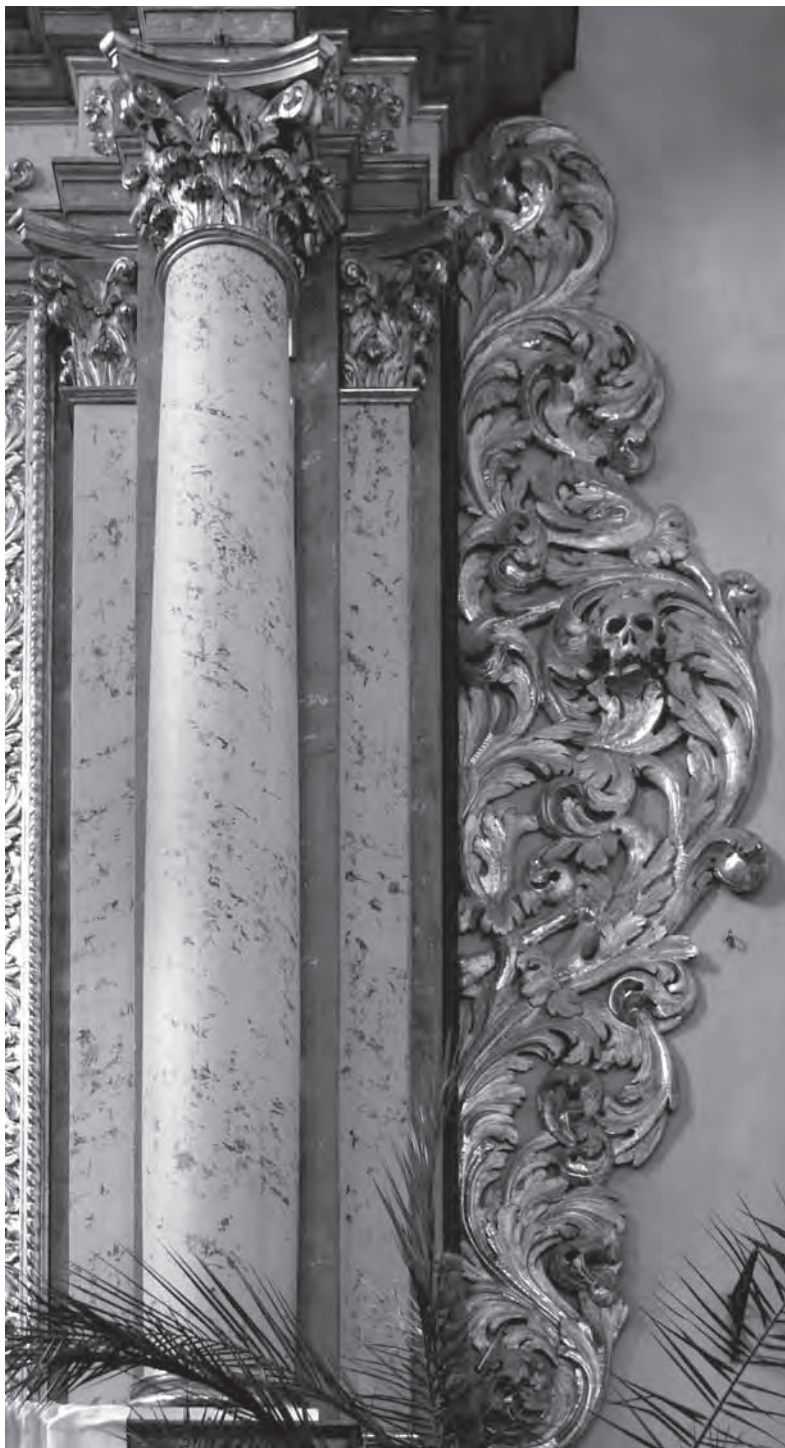
■ Ukázka spolupráce štukatéra, řezbáře a pozlacovače