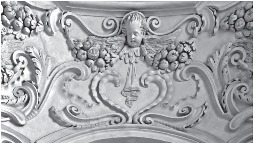
■ Bohatá štuková výzdoba boční kaple