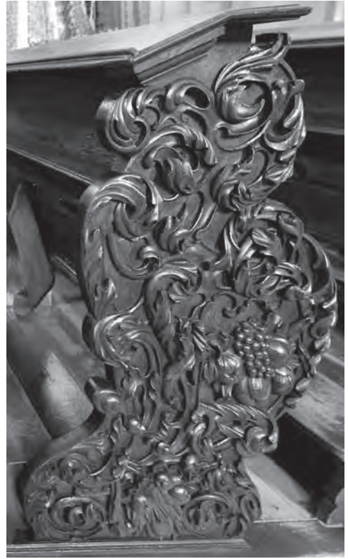
■ Postranice chrámové lavice, řezbářská práce