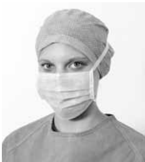
Obr. 1 Správně nasazená operační čepice a operační ústenka. Čepice pokrývá celou vlasatou část hlavy, nosní pásek operační ústenky pevně sedí kolem nosu, dvě tkaničky z každé strany (spodní pod ušima, horní na temeno)

Operační pláště musí být dostatečně dlouhé a uzpůsobené tak, aby zakrývaly celá záda a aby tato část byla po celý operační výkon sterilní.