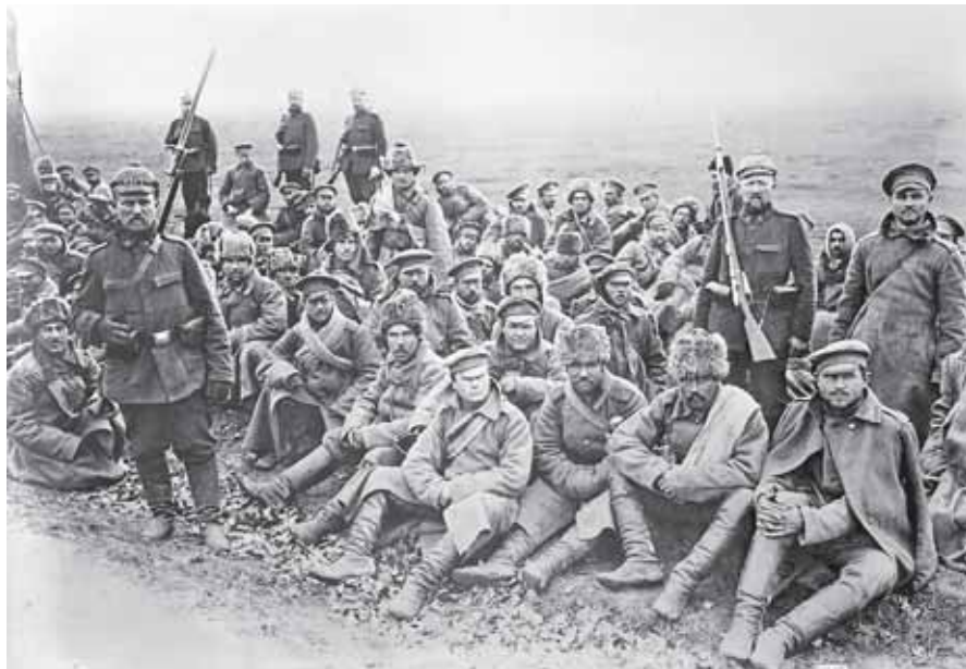
Hned v prvních měsících války padly do zajetí desetitisíce ruských vojáků

početního stavu dobrovolnického vojska, které se stalo nepostradatelným a určujícím faktorem v diplomatickém vyjednávání o existenci nového československého státu.