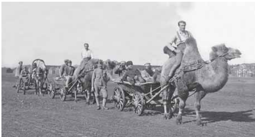
Někdy však nebylo co přikrášlovat, jelikož zajatci v některých oblastech namísto koní využívali exotických velbloudů

doplňovány údaji a poznatky z doby, kdy je jejich autoři psali. Číselné údaje jsou většinou nepřesné. Autoři se pochopitelně do jisté míry přizpůsobovali čtenářské poptávce, tj. často popisovali více exotické krajiny a zvyky tamních obyvatel, než samotný zajatecký tábor a život v něm.