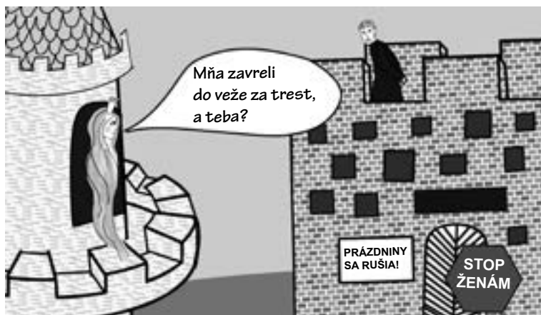
Obrázok 1 Celibátna formácia – zlatá klietka

Jedno latinské príslovie hovorí: Habent sua fata libelli – Aj knihy majú svoje osudy. Teologická problematika svätenia ženatých mužov za kňazov v Rímskokatolíckej cirkvi je prepletená s mojím osobným príbehom. Napriek tomu, že ide o objektívny problém celosvetovej Katolíckej cirkvi, a nie o „citové výlevy“ jednotlivca, kontext vzniku tejto publikácie by mohol pomôcť lepšie pochopiť problematiku svätenia ženatých.