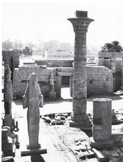
Taharkův sloup na prvním nádvoří v Karnaku

chala Ptolemaiovcům mnoho ze svého umění a vědění, a skrze ni a svět řecko-římské antiky tak ovlivňovala počátky naší civilizace bezprostředněji než období předchozí. Přicházíme-li dnes do slavného chrámu v luxorském Karnaku, vítá nás z dálky dvojice mocných pylonů. Mezi Karnackým a Luxorským chrámem se dochovaly zbytky monumentální aleje sfing. Oba tyto skvosty nechal vybudovat Nachtnebef, jeden z posledních faraonů 30. dynastie, o němž bude také v této knize řeč. Na prvním nádvoří nás uchvátí mohutný sloup s papyrovou hlavicí, vztyčený černým faraonem Taharkou. Nové podzemní rameno věhlasného pohřebiště posvátných býků, Serapea v Sakkáře, založil faraon Hakor a dostavěli jej jeho nástupci. Esetin chrám na Fílé vznikl za Ahmose II. a Nachtnebefa.