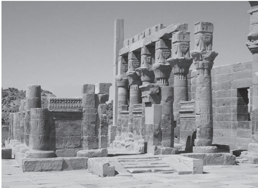
Vestibul Esetina chrámu na ostrově Fílé

Dvě následné perské nadvlády naznačují, že třítisíciletá říše se blíží ke svému konci. Nikdo v té době nemůže tušit, že ptolemaiovské finále Egypta bude ještě velmi oslnivé. Byla to však právě Pozdní doba, která jako nejmladší přivítala makedonského krále Alexandra a přene-