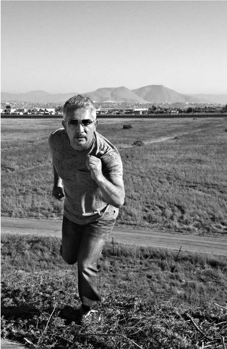
Späť tam, kde to všetko začalo: môj návrat na hranicu blízko San Ysidra v Kalifornii v roku 2012.