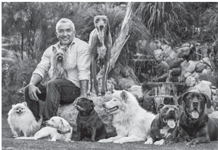
Doma a v Centre pšej psychológie som obklopený stále rastúcou svorkou krásnych psov.

a úkryt, čo nakoniec vyústilo do unikátnej medzidruhovej náklonnosti.