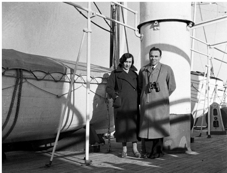
Baumovi na palubě lodi Romolo

V srdci každého z nás se rodí a dřímají přání – osud některé splní a jiné probudí, aby se svou silou a žářem sama probjovala obtížemi.