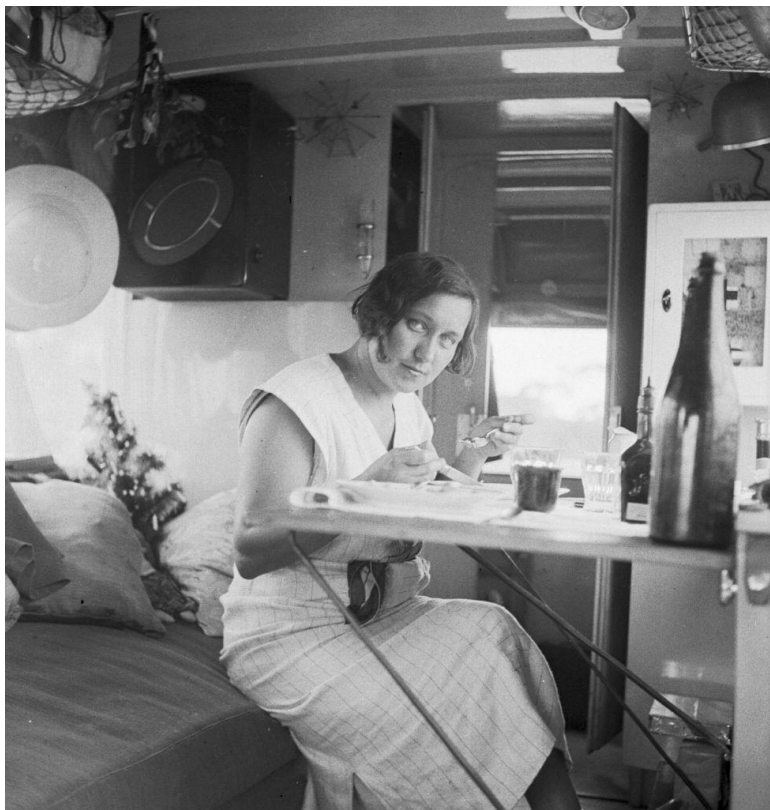
Snídaně ve voze

Měníme nekonečnou modř oceánů za zeleň australského pobřeží. Poslední dny jsme trochu nepokojní. Střídavě vyhlížíme na obzoru tmavý pruh země anebo se snažíme nepozorovat rozčilení tím, že částečně balíme a zdánlivě klidně si vyměňujeme adresy a fotografie