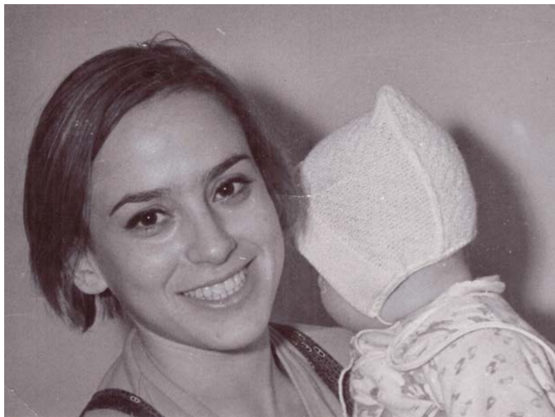
Bella a ja (1966)

Dnes mi tieto cesty veľmi chýbajú. Spoločné cestovanie už nezávisí od mojej vlastnej vôle. Čakanie je ukrutne ťažké. Podobne ako vydržať nerozprávať sa s tebou. Aspoň telefonicky... A tak čakám. Na správny sen.