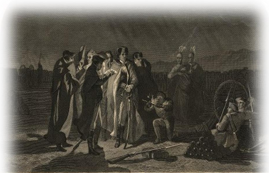
THE NIGHT COUNCIL AT FORT NECESSITY

Villiers přeskupil oddíly a začal tvrdě pevnost a předsunuté linie ostřelovat. I když Britové palbu opětovali, jejich střelba nebyla zdaleka tak účinná. Střely z mušket a kanónů létaly Francouzům vysoko nad hlavou a navíc začalo znovu hustě pršet, což mělo neblahý účinek na špatně chráněné pevnostní zásoby munice.