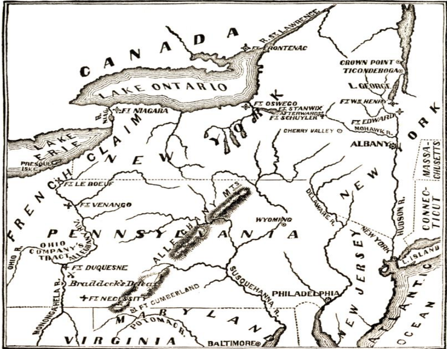
MAP OF THE SCENE OF OPERATIONS.