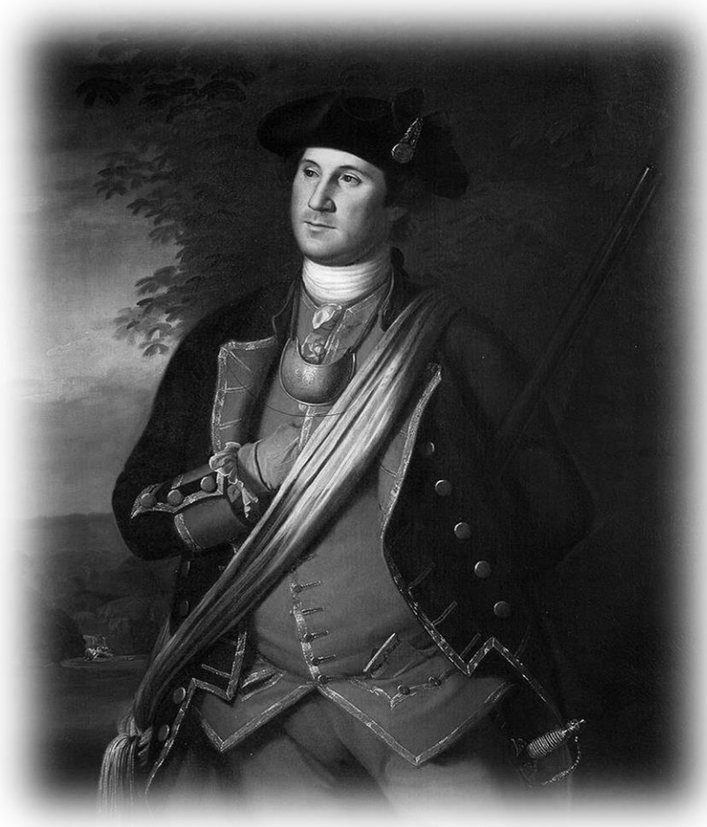
George Washington 1772

Anglická pevnost nebo spíše palisádová ohrada s jedinou budovou uprostřed byla dokončena třetího června a Washington ji pojmenoval Fort Necessity. Palisády byly dva metry vysoké a uvnitř stál provizorní muniční sklad. Do devátého připochoval virginský regiment a hned po něm oddíl