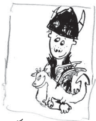
Štikút a Bezzubý

Vydal aj ďalšie dve vedecké diela Učíme sa dračtinu , a Morské panny a iné obludy . Je pravidelným prispievateľom Veľkého dračieho mesačníka .