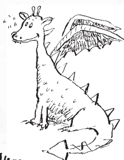
OBYČAJNÝ, ČIŽE ZÁHRADNÝ ALEBO HNEĐÁK OBYČAJNÝ

Najlepšie sa hodia za domáce zvieratá, hoci ako pri levovi či tigrovi, nikdy by sme ich nemali nechať bez dozoru pri malých deťoch.