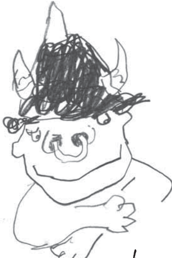
Psi' dych Tik