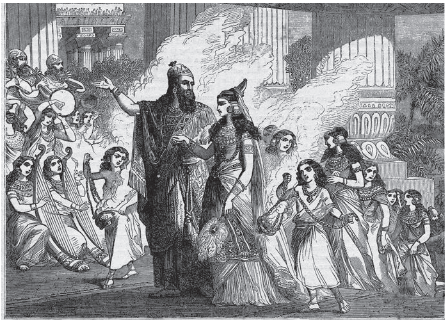
Královna ze Sábý na návštěvě u krále Šalomouna

Téměř vše, co je nám známo o plánu a stavbě Šalomounova chrámu, pochází ze Starého zákona, především z knih: 2. Samuelova , 1. Královská a 1. Paralipomenon . Z 2. Královské víme o zaboru Jeruzaléma Asyřany roku 586 př. Kr., o tom, jak zničili město, vypálili Šalomounův chrám a obyvatele poslali do vyhnanství v Babylonu, kde jejich nářek zachycuje Žalm 137,1 : „U řek babylónských, tam jsme sedávali s pláčem ve vzpomínkách na Sión.“