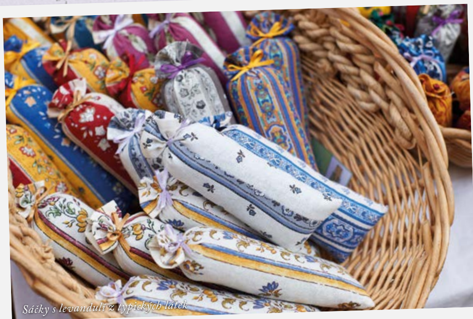
Sáčky s levandulí z typických látek

jsou tak typické jako levandule nebo keramika, ale zároveň dýchají Orientem. Původ těchto látek musíme opravdu hledat v Indii. Na počátku 17. století se tyto pestré tkaniny začaly dovážet do Marseille a celé Francie a způsobili doslova