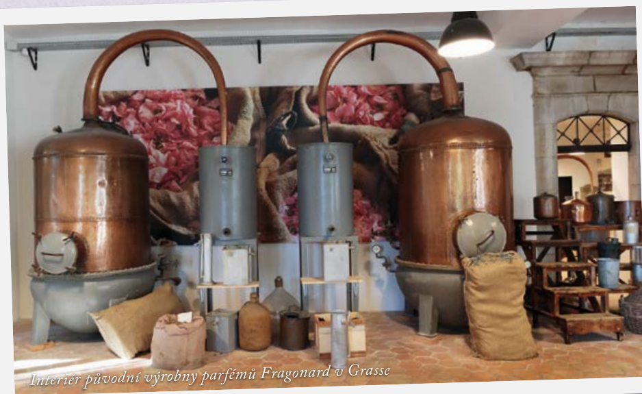
Interiér původní výroby parfémů Fragonard v Grasse

Při výletu do Grasse stačí jediné: vnímat barvy a struktury domů, které tvoří zdejší uličky, inspirovat se nezaměnitelnými interiéry zdejších obchodů a především doslova nasávat zdejší atmosféru. Město je obklopeno poli a zahradami, vonícími levandulí, myrtou, jasmínem, růží, mimózou, květem pomerančovníku a dalšími bylinami, které dohromady tvoří opojné kombinace vůní – a to i včetně těch interiérových. Není snadnější způsob než si do svého bytu přenést atmosféru Provence – o mnoho sofistikovanější, než je „pouhá“ vůně levandule, ale o nic méně autentickou.