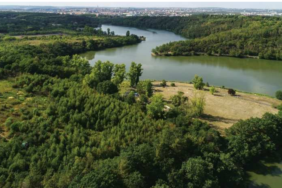
Botič je po Vltavě nejvýznamnější pražský vodní tok o délce 33,5 km a s rozlohou povodí 135 km 2