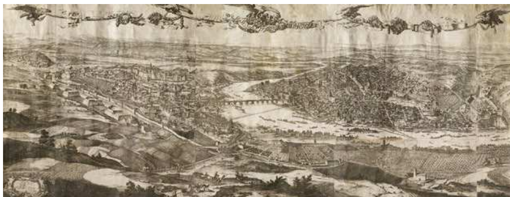
Pohled na Prahu v barokních hradbách z výšin nad Smíchovem. V popředí vlevo Petřín s Hladovou zdí a Újezdská brána, vpravo kostel sv. Filipa a Jakuba na Smíchově, dále vidíme zleva Strahovský klášter, Hrad, Karlův most, Střelecký ostrov, Staré Město, Nové Město, Vyšehrad, ale i okolí: dnešní Břevnov, Libeň, Karlín, Žižkov, Vinohrady, Pankrác, Krč a Smíchov