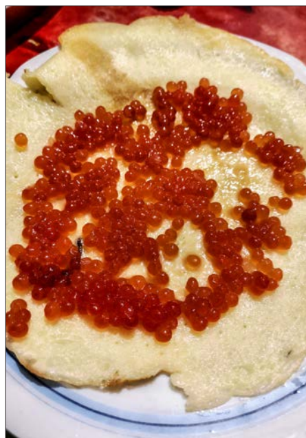
Zvláštna kombinácia nielen pre oči, ale aj pre brucho