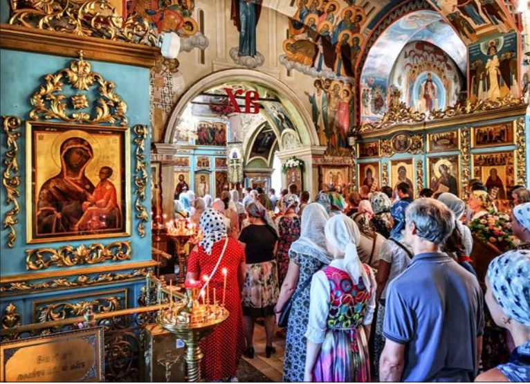
Naľavo hore: V komplexe Caricyno sme navštívili aj pravoslávnu liturgiu.

Napravo: Už-úž som sa skoro posadil na tento drevený cársky trón v Kolomenskom, keď ma rýchlo zhatila strážiacca tetuška, vraj sa to nesmie. Nevedel som, nech mi je odpustené. Každú miestnosť totiž vartovala jedna dobovo oblečená pani.