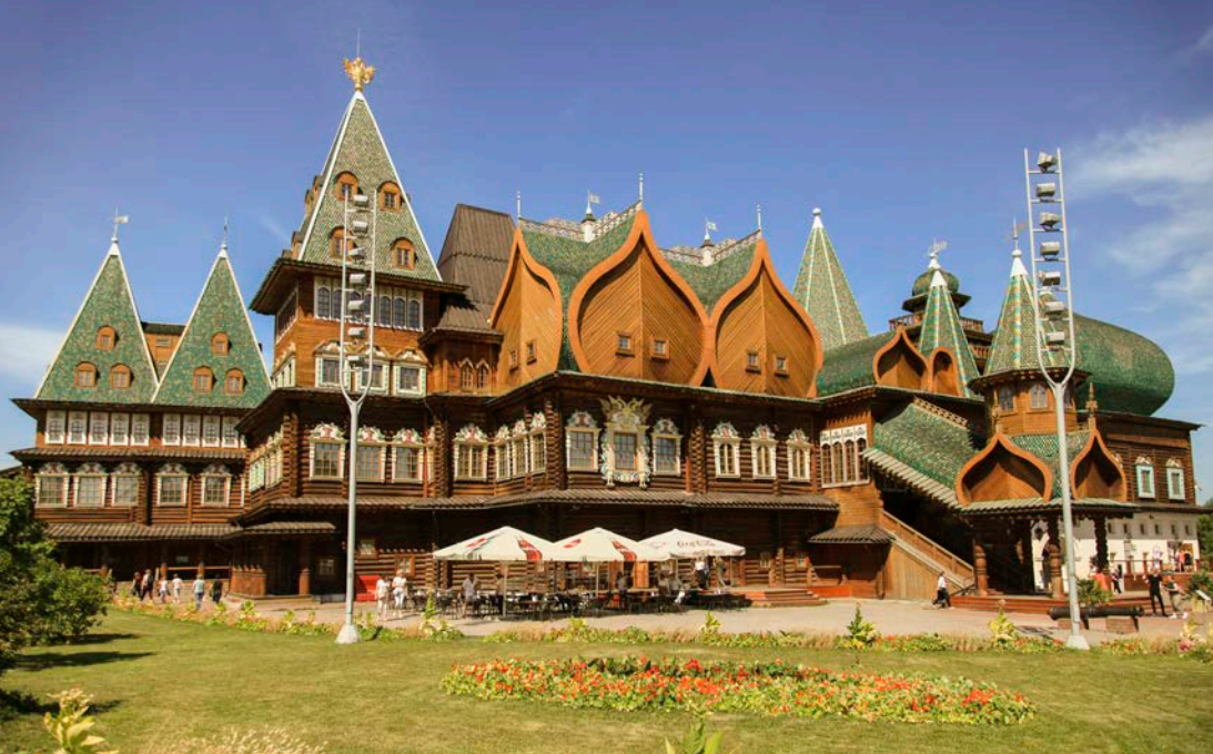
Palác cára Alexeja Michajloviča bol drevený kráľovský palác postavený v obci Kolomenskoje mimo Moskvy v druhej polovici 17. storočia. Predstavoval veľmi zložitý systém jednotlivých drevených miestností spojených prechodmi. Jeho bohatý a exotický dekor vždy vyvolal obdiv cudzincov, ktorí ho videli.

18 storočí, ale Rusi ho v roku 2010 znova postavili. Klobúk dolu pred staviteľmi, niet detailu, ktorý by na tejto úžasnej, nie malej drevenej stavbe zanedbali, a to platí aj na vnútro. Kúpili sme si vstupenky a prešli sa dobovým vnútrom, už sa pýtalo schovať sa pred silným obedňajším slnkom.