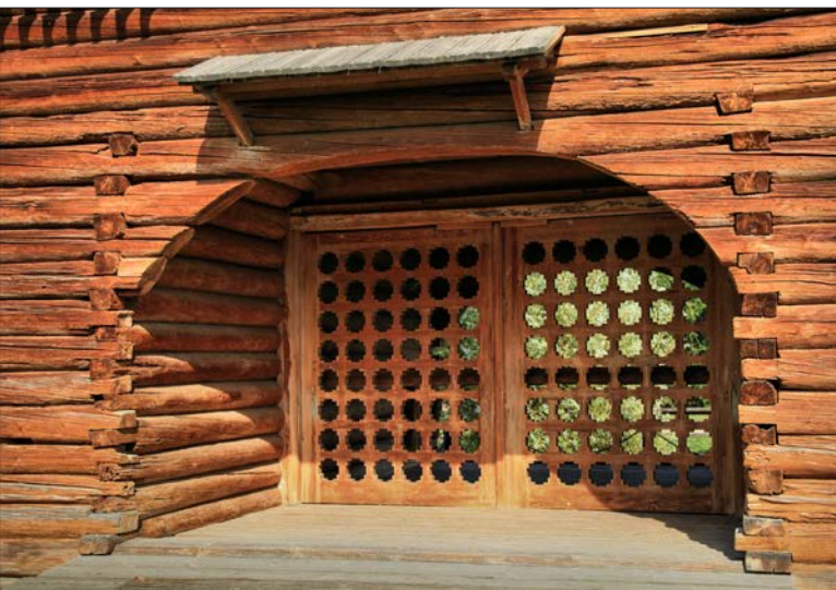
Naľavo dolu: Drevená brána z jednej z mnohých drevených historických budov v Kolomenskom. Napravo: Ikonový oltár z chrámu Jána Krstiteľa.

V kostole je zakázané fotiť. Neprebíeha v ňom však liturgia, a tak „na pankáča“ robím pár záberov aspoň s mojím novým telefónom Huawei P20 Pro. Dva mesiace pred touto cestou mi skončilo akurát dvojročné viazané obdobie u môjho operátora, a tak som s možnosťou výberu nového mobilu špeciálne selektoval taký, ktorý bude