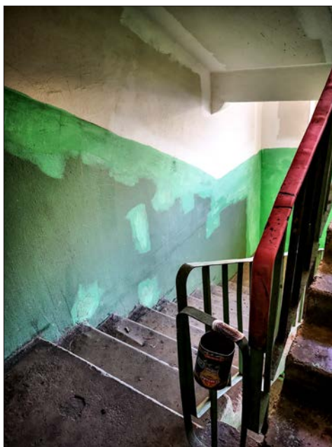
Neútulné sídliskové schodisko, kde však populník nechýbal