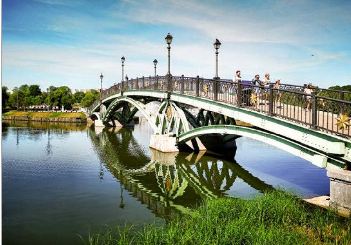
Park je aj miesto, kde sa každý rok prvého júna koná stretnutie moskovských hippies, aby privítali prichádzajúce leto

Z tohto prekrásneho miesta sa metrom presúvame tri stanice do múzea v prírode, Kolomenskoje. Prechádzku tohto komplexu začíname dreveným cárskym palácom, ktorý bol síce zničený v 18.