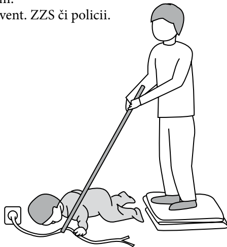
Obr. 1 Odstranění vodiče