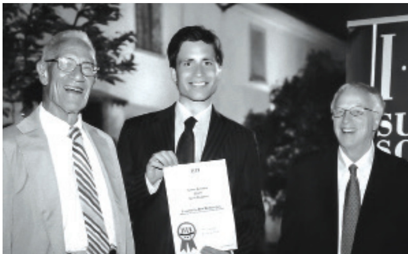
Autor knihy medzi dvoma z najvýznamnejších ekonómov, nobelistami Robertom Solowom (vľavo) a Georgom Akerlofom (vpravo).