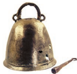
Zvon z prelomu 8. až 9. storočia (Bojná)

Na šírení kresťanstva má nespornú zásluhu rád benediktínov. V roku 529 založil sv. Benedikt z Nursie (kraj Umbria v strednom Taliansku) kláštor v Monte Cassine, ktorý sa stal kolískou benediktínskej rehole. Jej heslo Ora et labora – Modli sa a pracuj prenikalo do sveta stredovekého