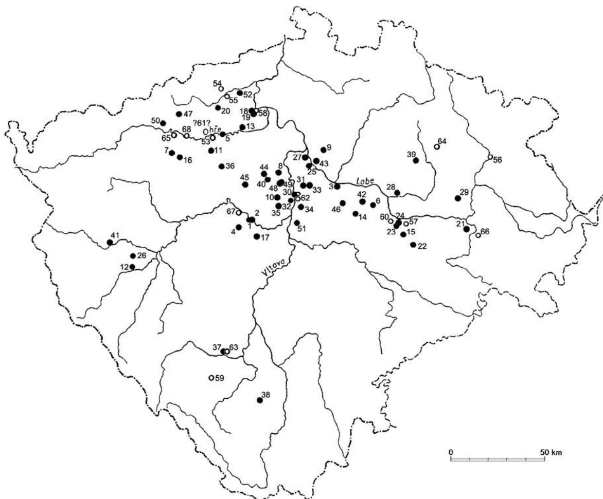
Mapa 1 Nálezy terra sigillaty v Čechách (plné kolečko – lokality uvedené v 1. části katalogu; kroužek – lokality uvedené ve 2. části katalogu).

Autorem části vyobrazení a fotografií jednotlivých kusů TS nebo germánské keramiky je autor této práce, část dokumentace pořídila či upravila G. Halam-Leite (též sazba kreseb a fotografií TS). Některá vyobrazení jsou převzata z literatury citované u příslušných lokalit v katalogovém soupisu či v popisích tabulek, map a obrázků.