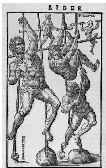
Obr. 2.1: „Gymnasté“ na lanech (Mercurialis, 1601)

Ačkoli Řekové a Římané nepovažovali lezení za klasickou sportovní disciplínu jako běh, skok, zápas, hody diskem a oštěpem, můžeme se přesto domnívat, že lezení bylo součástí tělesné přípravy. Renesanční lékař Hieronymi Mercurialis (1530–1606) zdokumentoval ve své knize De arte gymnastica Libri sex tělesnou kulturu u antických národů a z obrázku této knihy je patrné, že v přípravě atletů bylo využíváno šplhání po lanech (obr. 2.1).