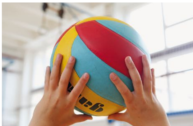
Fotografie 3 Košíček z prstů a dlaní pro odhod míče

Základem tohoto způsobu odbíjení je vytvoření košíčku z prstů a dlaně. Ten je vidět z fotografie 3 . Hráč při něm zvedne ruce před tělo nad úroveň očí. Míč dopadá do „košíčku“, při kterém jsou prsty natažené, zpevněné a vzdálené od sebe. Palce směřují mírně k tělu hráče, v okamžiku dopadu míče do prstů se zápěstí zvrátí vzad. Při odhodu se nohy s pažemi natahují a prsty mírně zaklápí.