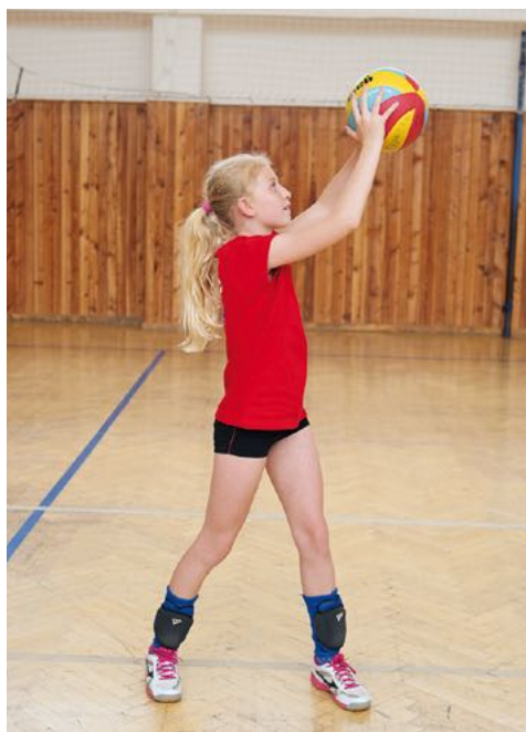
Fotografie 1 Chycení míče s odhodem před tělem

Při chytání a házení stojí hráč v širším stoji rozkročném, jedna noha předsunuta o půl až jednu stopu před druhou. Nohy má pokrčené v kolenou a hmotnost těla přenesenou na přední části chodidel. Paže jsou ohnuté v loktech, ruce s prsty mírně roztaženými před tělem, palce