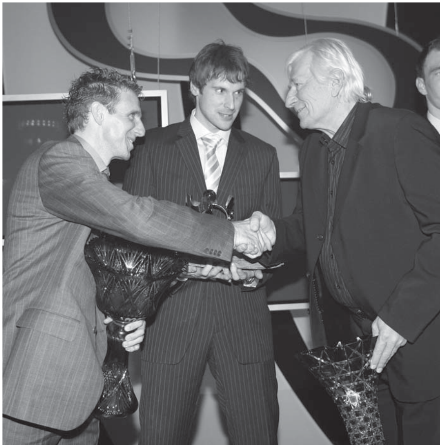
Při vyhlášení anket Osobnost ligy, Fotbalista roku a Trenér roku za rok 2005 se sešli jako nejvýše ocenění Karel Poborský, Petr Čech a Karel Brückner

asociální mistrovství Slovenska , soutěž hraná v letech 1925–1933, ve které se utkával v jednom, později ve dvou utkáních svazový mistr Slovenska (vítěz turnaje mistrů tří slovenských žup ČSSF) s mistrem žup, patřících pod Maďarský svaz v ČSR (MLSz). Vítěz postupoval do → amatérského mistrovství ČSR .