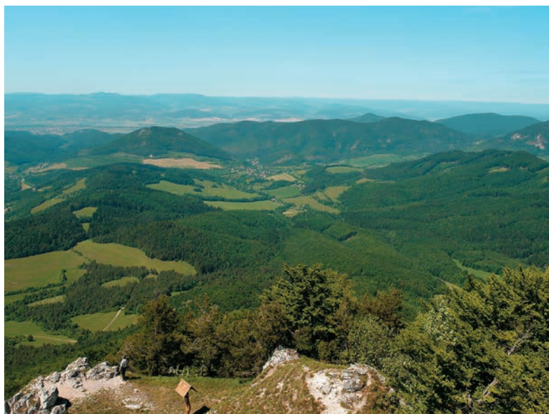
Pohľady z Vápeča

možno vidieť unikátny a autentický doklad o prítomnosti Rimanov na území Slovenska. Nápis na strmej stene trenčianskej hradnej skaly vytesali na pamiatku víťazstva nad Kvádmi v roku 179. Od hotela sa vyberieme po ceste č. 61 severným smerom. Po pár kilometroch