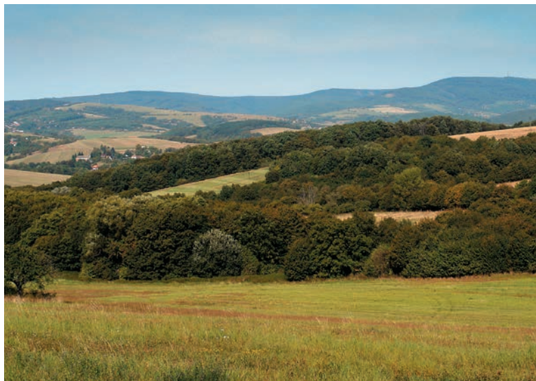
Kopanice v podhorí Bielych Karpát Cestou do Brezovej pod Bradlom

Historicko-geografické danosti predurčili aj spôsob využívania tohto kraja. Kolonizovaný bol pomerne neskoro, najmä počas valašskej kolonizačnej vlny v 16. a 17. storočí. Osídlenie nadobudlo prevažne kopaničiarsky charakter, avšak nesústredovalo sa do dolín, ako je zvykom v ostatných častiach Slovenska. Dediny, osady a samoty s okolitými sadiami a poľami zabrali vyvýšeniny, doliny zostali do veľkej miery zalesnené. Ani sieť ciest nekopíruje sieť dolín, prechádza po širokých oblých chrbtoch. Cesty sa kľukavia po vrškoch a poskytujú mnoho nádherných výhľadov na