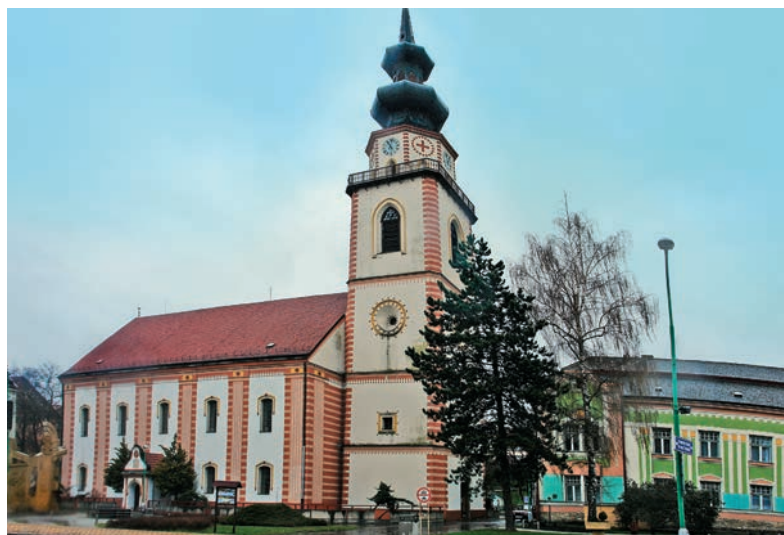
Evanjelický kostol v Myjave

Z centra Brezovej pod Bradlom sa vyberieme na severozápad smerom na Bukovec. Pri ceste na malom kopci hneď za okrajom mesta stojí pamätník pripomínajúci tzv. meruôsme roky. V 18. storočí totiž začalo výrazne narastať národné povedomie Slovákov. Tento proces vyvrcholil v prvej polovici 19. storočia. Jedným z centier národného hnutia v revolučných rokoch 1848 a 1849 bola aj Myjava a Brezová pod Bradlom.