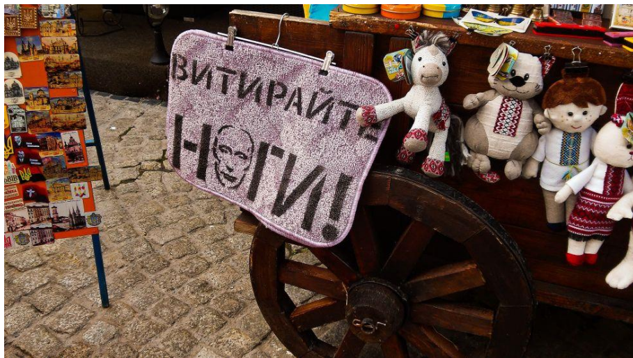
Otřete si nohy!

Opustíme věž a vydáme se na nedalekou tržnici. Tam mimo jiné prodávají nejrůznější předměty posilující národní vědomí a odpor vůči Rusku. Například originální rohožky s obličejem ruského prezidenta Putina: