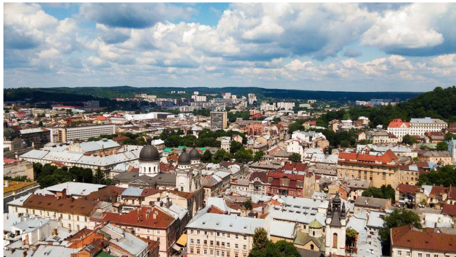
Výhled z věže, kostel Proměnění Páně v levé části