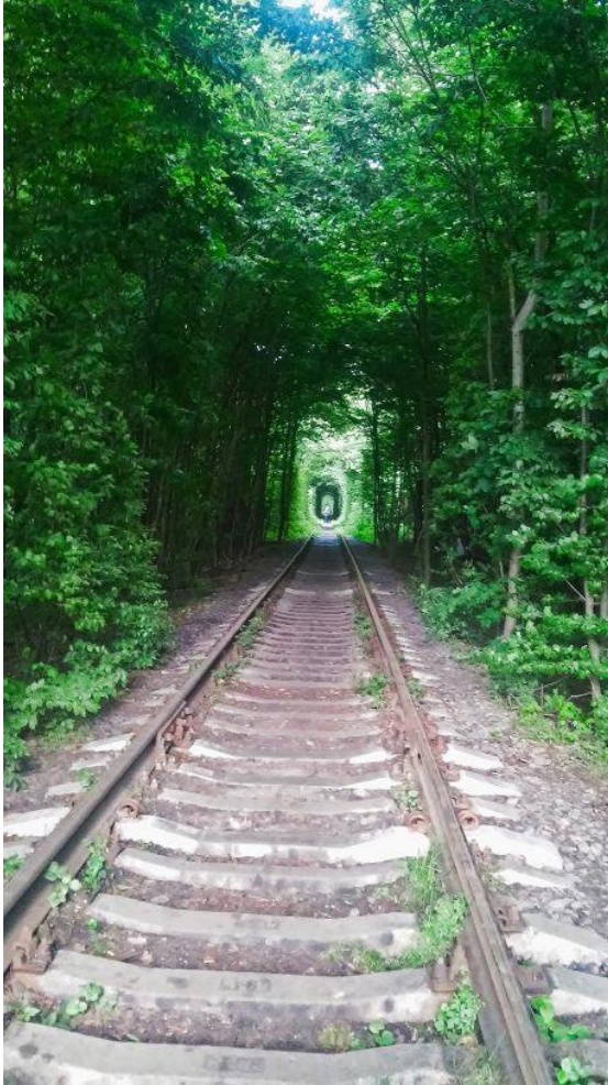
Ideální místo pro první rande

Neváháme a vyrážíme na procházku. Jaká romantika, tři kluci v Tunelu lásky, že? Ironické myšlenky však poměrně rychle zažene neskutečné množství dotěrných komárů, za které by se nemuselo stydět ani slovenské město Komárno.