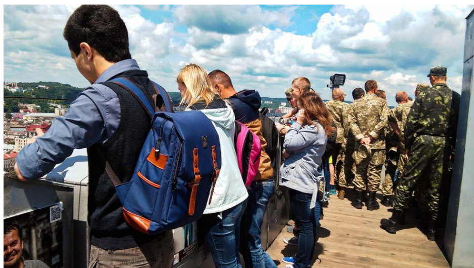
Vojáci na vyhlídce. I když beže zbraní konflikt s Ruskem asi nevyhrají...