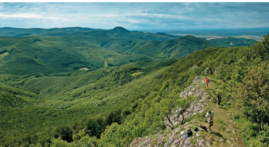
Pohľad z Vápennej