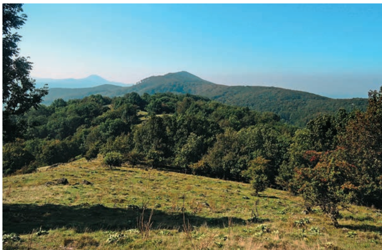
Pohľad z Klokoča na Vápennú a Vysokú

Malé Karpaty prečnievajú viac ako 500 m nad okolité roviny a sú vhodným miestom pre pravú horskú cyklistiku. Na našej trase navštívime štyri „vyhladkové“ malokarpatské vrcholy: Veľkú homoľu s vyhladkovou vežou, malebný lúčnatý Klokoč, krásnu bralnatú Vápennú i zaujímavú Skalnatú.