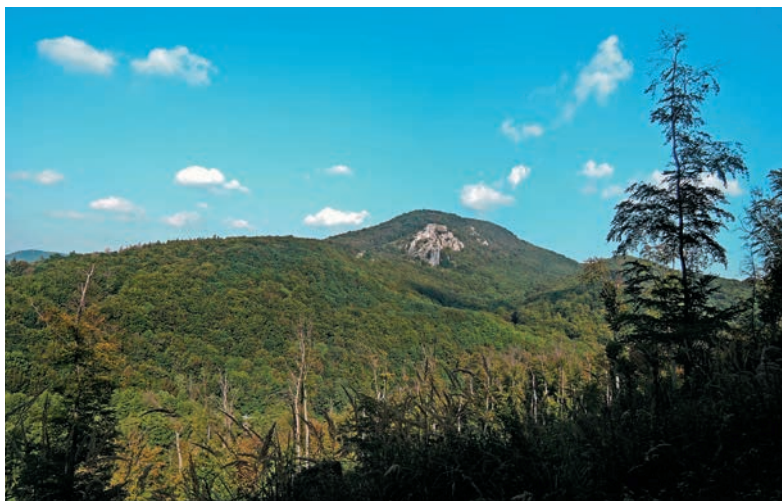
Malá Vápenná spod Veľkého Peterklína

odbočíme doprava na úzky chodník, ktorý nás privedie na červenú hrebeňovku. Po nej cez smrekovcový les vyjdeme na vrchol Skalnatej.