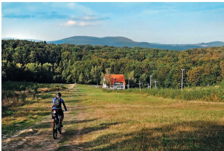
Zjazd z Veľkej homole na Zochovu chatu

Z Veľkej homole strmo zídeme do sedla, ktorým sme prechádzali, a ďalej pokračujeme po kamenistej lesnej ceste popri hvezdárni do rekreačnej oblasti Modra-Piesok, známej ako Zochova chata. Naša trasa pokračuje chvíľu východným smerom po asfaltovej ceste, z ktorej odbočíme doľava na lesnú cestu v smere modrej turistickej značky. Pomedzi chaty vyjdeme na čistinku s výhľadom a potom lesom strmšie zídeme na Zajačí jarok. Po lesnej ceste severným smerom (zelená cyklotrasa) prídeme do Častej-Papierničky. Z mierne klesajúcej asfaltky odbočíme v časti Horná Píla doľava. Stúpame cez les, až kým dosiahneme plošinu s parkovou úpravou v okolí mohutného zachovalého hradu Červený Kameň. Pôvodný hrad tu stál už v 13. storočí, terajší hrad pochádza zo 16. storočia a dlhé stáročia až do roku 1945 ho vlastnili Pálffyovci. V súčasnosti je v ňom múzeum a v blízkosti reštaurácia. V peknom francúzskom parku odbočíme z asfaltovej cesty doľava na lesnú cestu (zelená turistická