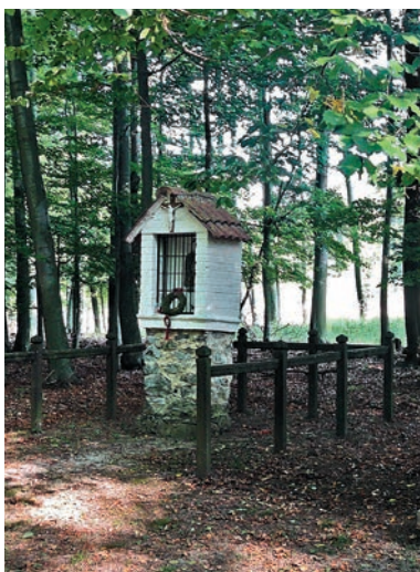
Božia muka sv. Hubert

Počas klesania lesom sa napravo objaví pôsobivá božia muka s obrázkom sv. Huberta a upraveným okolím. Ďalej stromovou alejou a cez lúky prídeme pod vrch Geldek,