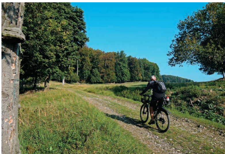
Nad Červeným Kameňom

stúpaní vyjdeme do sedla Pod Veľkou homoľou, odkiaľ je to na vrchol po strmom svahu kúsok. Pre bicykel je však vhodnejší výstup obchvatom po lesnej zväžnici, ktorou sa dostaneme na červenú hrebeňovku a po nej pohodlne dôjdeme na vrchol Veľkej homoľe. Na vrcholovej čistinke stojí 21 m vysoká drevená rozhľadňa, z ktorej je kruhový výhľad. Pri nej sa nachádzajú drevené prístrešky.