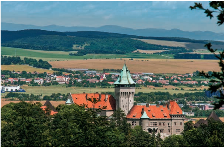
Smolenický zámok z Molpíra

Úchvatná malokarpatská krajina okolo Smoleníc dáva turistom niekoľko možností vnoriť sa do hustej bučiny, počúvať šplechot padajúcej vody vodopádu či vniknúť do podzemia a obdivovať nevšednú krásu kvapľovej jaskyne. Osloví však aj milovníkov krásnych vyhlíadok a rozprávkových krajinárskych scenérií.