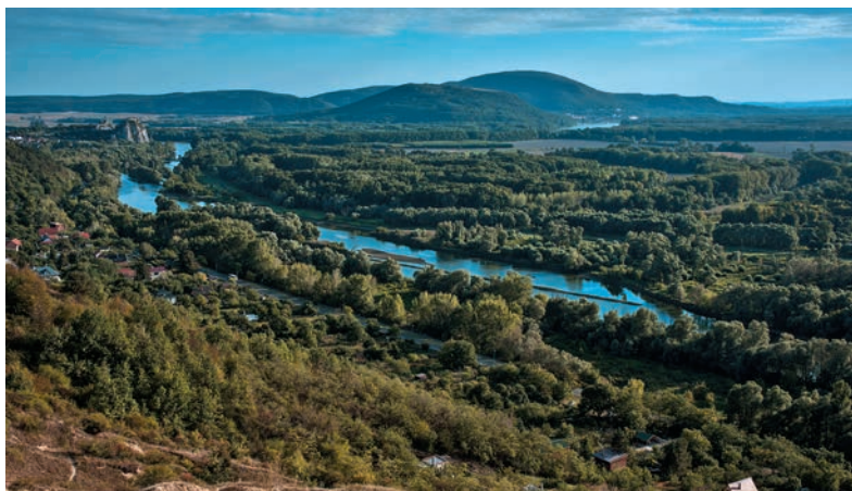
Rieka Morava zo západného svahu Devínskej Kobily

treťohorného mora. Obídením návršia, na ktorom kedysi stálo veľkomoravské hradisko, sa nám postupne predstaví vyhlídkové bonbóniky. Pod skalným útvarom sa trbliete hladina pohraničnej rieky Morava. Za ňou sa dá dobre rozpoznať noblesná architektúra dolnorakúskeho zámku Schlosshof, viac vpravo vidieť Cyklomost slobody umožňujúci pohodlný prístup k zámku z Devínskej Novej Vsi pešo alebo na bicykli. Prehliadkové defilé ukončuje krásna panoráma južnej časti Záhoria siahajúceho vľavo až po svahy Malých Karpát.