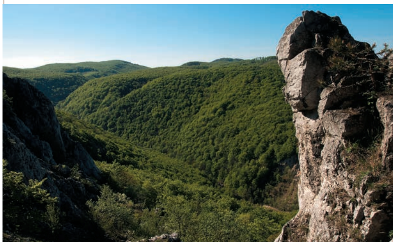
Mokrú dolinu z Kršlenice

Baborskú s obmedzeným, ale krajinársky pekným výhľadom na Malé Karpaty a Borskú nížinu. Na Amonovej lúke odbočíme doľava a po červenej turistickej trase sa pohodlne dostaneme k poľovníckej chate Mon Repos. Krátke odbočenie po zelenej značke do Mokrej doliny nám síce neponúkne nijakú vyhliadku, avšak oplatí sa ju urobiť pre krasové útvary Plaveckého krasu. Na pravej strane doliny leží jaskyňa Tmavá skala a na ľavej Deravá skala. Obe jaskyne sú známe ako významné paleontologické