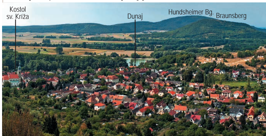
Devín z juhozápadného svahu Devínskej Kobily

Za hornou vyhlídkou (2) treba vystúpiť nad žltú stenu Sandbergu po žltó značkovanom chodníku obchádzajúcom pieskovisko z ľavej strany. Výhľad z hornej hrany lomovej steny má ešte veľkolepejšie rozmery a kvality ako výhľad od vodárne. Za priaznivého počasia sa na západnom horizonte dajú rozpoznať výškové stavby Viedne a vzdialené končiare rakúskych Álp. Smerom na juh v úžasnej panoráme ako magnet oko turistu priťahuje rieka Morava a silueta hradu Devín, ku ktorému sa postupne priblížime.