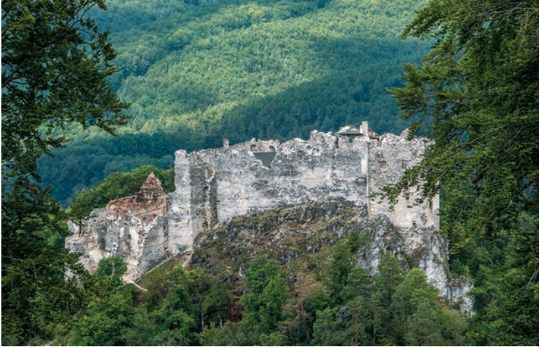
Hrad Uhrovec od juhu

Priamo v srdci Strážovských vrchov nájdeme legendami opradený hrad Uhrovec. Trasa smerujúca od neho na východný okraj pohoria nás zavedie až k romantickému Bojnickému zámku, postavenému na pôvodne stredovekom hrade.