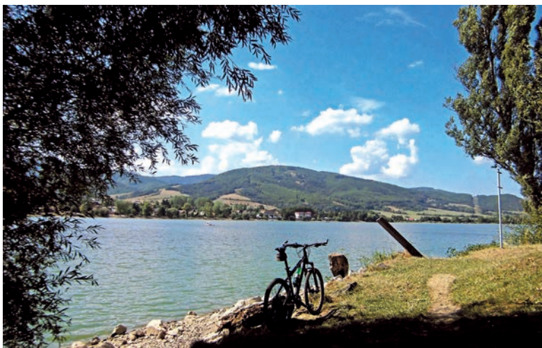
Vodná nádrž Nitrianske Rudno