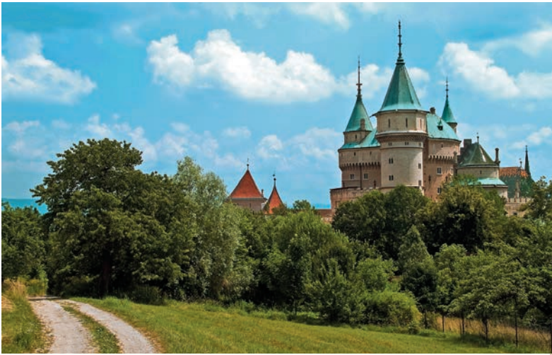
Bojnický zámok od západu

stredovekého hradu zvyčajne majú strmé strechy paláca, kaplnky a veží. Podľa nich ich ľahko identifikujeme už zďaleka, napr. z Hornonitrianskej kotliny.