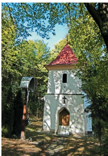
Kaplnka v Šútovciach

Klenotom Bojníc, kúpeľného mesta pri Prievidzi, je „rozprávkový“ Bojnický zámok (320 m), ktorý patrí k najnavštevovanejším a najkrajším zámkom nielen na Slovensku, ale aj v strednej Európe. Zámok postavili na travertínovej kope nad Bojnícami, na ktorej stál v 11. storočí stredoveký hrad. V minulosti ho vlastnili najslávnejšie šľachtické rody, pričom jeho poslednými vlastníčkami boli Pálffyovci. Typickú siluetu romantickej predstavy