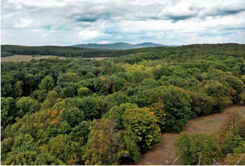
Výhľad z veže kostola

Desať rokov trvalo úsilie dobrovoľníkov z občianskeho združenia Katarínka, než sa im s veľkou námahou podarilo premeniť 30 m vysokú vežu bývalého Kostola a kláštora sv. Kataríny Alexandrijskej nad Naháčom na vyhladkovú vežu.