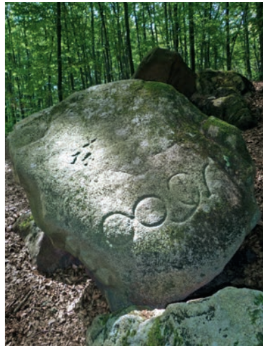
Písaný kameň na Kačine

Bratislavského hradu ako symbolu mesta. K balvanu treba prejsť 550 m od Kačina na sever ku spojke červenej a žltej trasy. Potom, po prejdení ďalších 240 m, treba odbočiť doprava po lesnej cestičke medzi dvoma dielmi lesa až k dolinke, nad ktorou sa balvan nachádza.