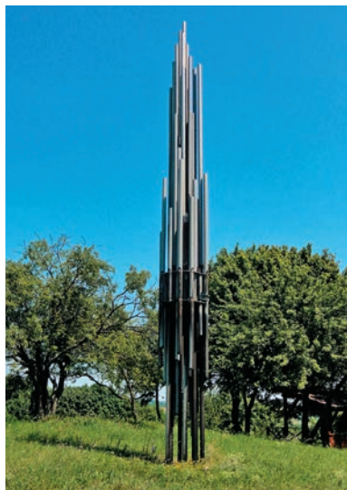
Pamätník SNP na kopaniciach U Rehušov

možného východiska k rozhradní, z Brezovej pod Bradlom, vedie na Bradlo s Mohylou generála M. R. Štefánika červeno a v závere zeleno značkováná trasa.