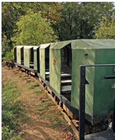
Lesná železnica Katarínka

sv. Cyrila a Metoda a pri ďalších slávnostných príležitostiach. Tesne pred koncom trasy z Naháča ku zrúcaninám sa vpravo nachádza prírodná rezervácia Katarína, v ktorej sú chránené teplomilné a suchomilné spoločenstvá s významným výskytom jašterice zelenej.