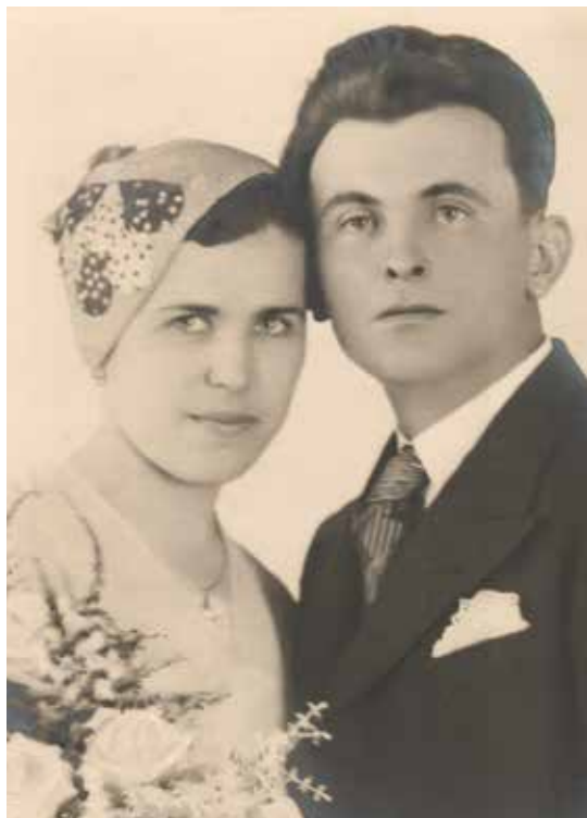
Svatební fotografie rodičů