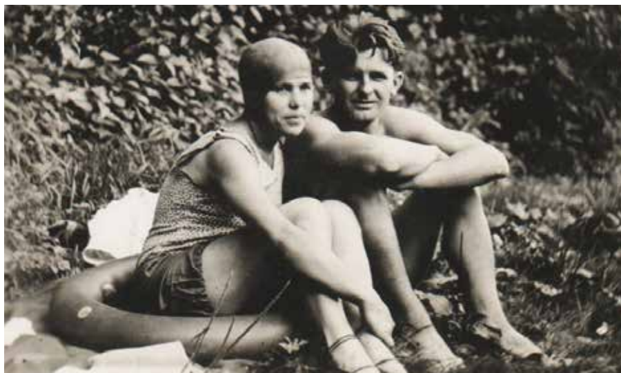
Novomanželé na plovárně