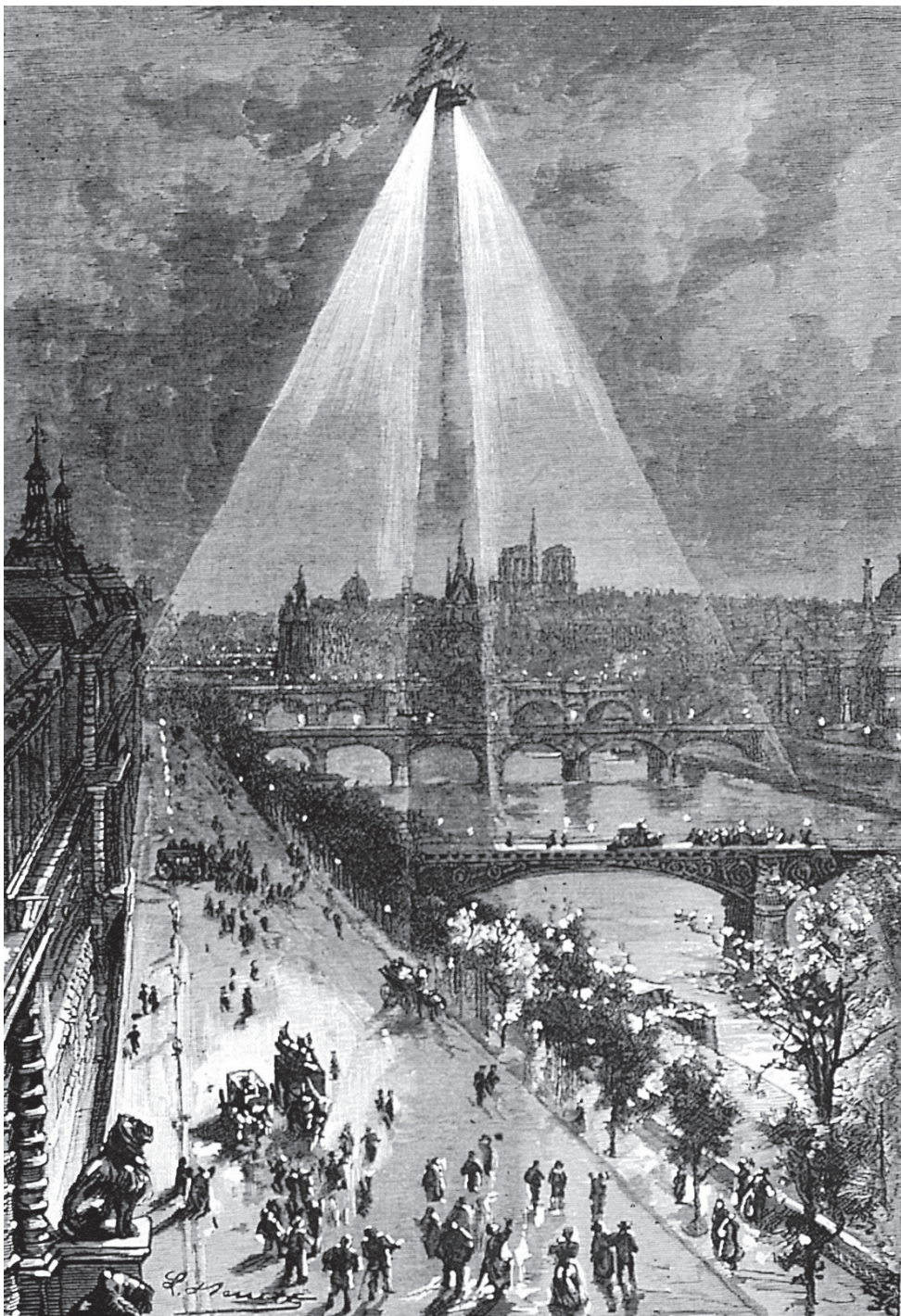
Inžinier Robur ukazuje pokrok Parížanom...