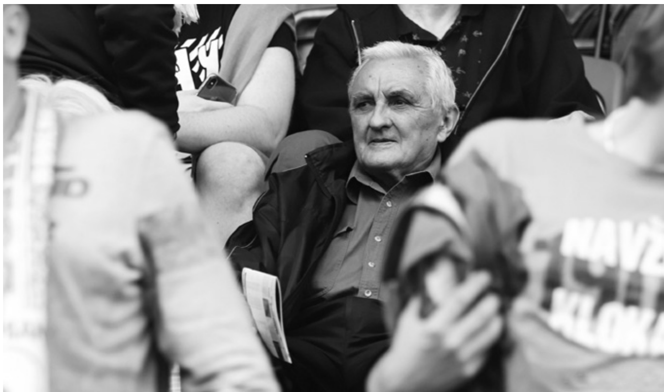
Autor na tribuně v Ďolíčku