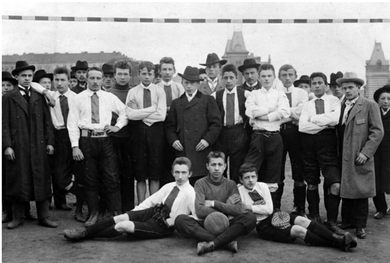
Takhle začínali vršovičtí sportovci v r. 1903 na „Šifneráku“. Tak zní autentická popiska z klubového almanachu a lokalizaci stvrzuje i rub fotografie, jenže uvedený rok 1903 nemáme jak ověřit, ale chyby v datacích byly v archivu AFK i u dalších a podstatně mladších snímků... Tito mladí muži již zjevně vlastní regulérní kopací míč a košile zdobí svislý našitý pruh, nikoli tedy vázanka