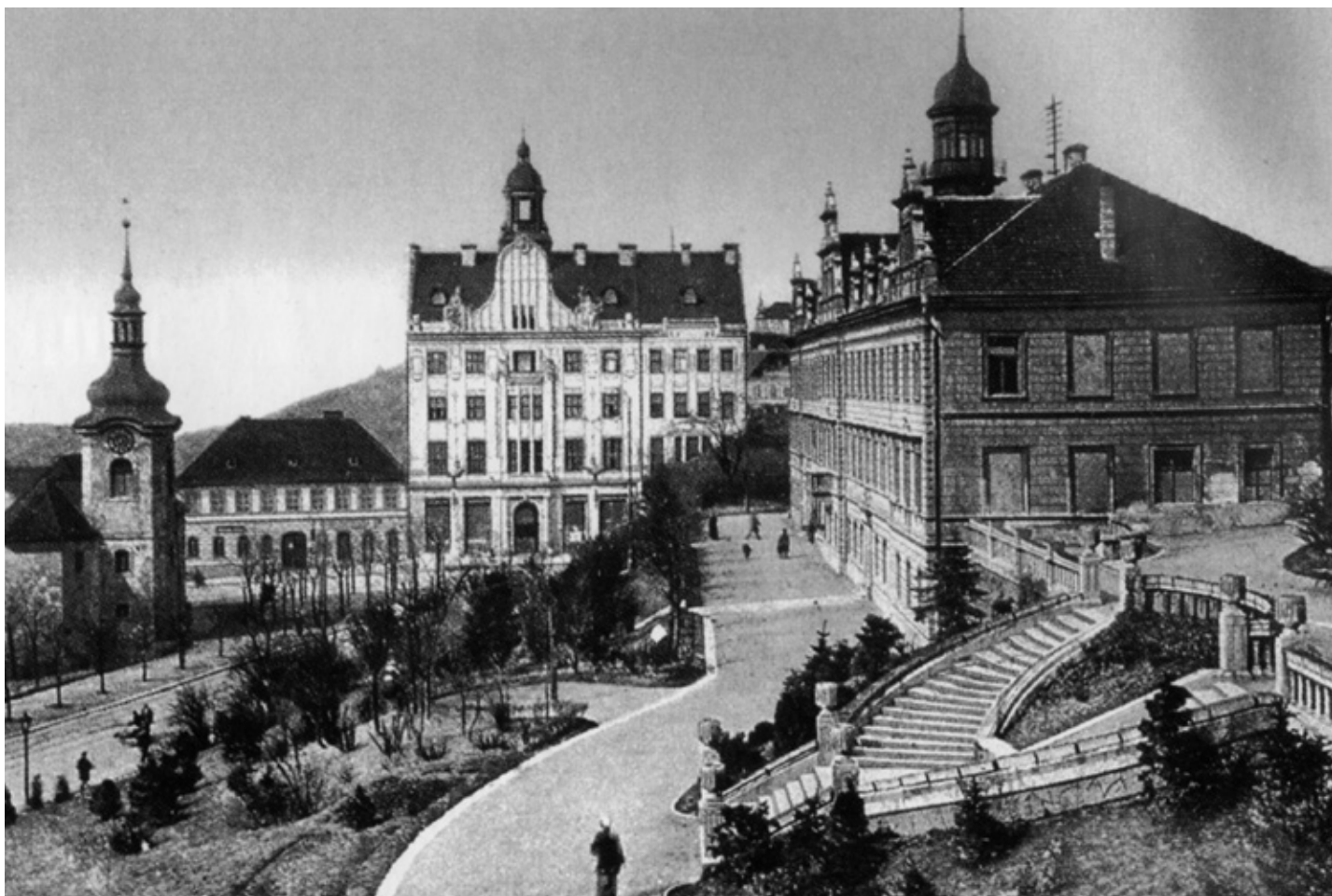
Vršovické náměstí s radnicí (vpravo), kostelem sv. Mikuláše a Občanskou záložnou (uprostřed)